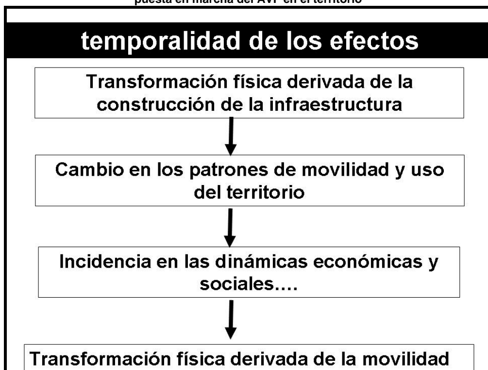
Figura 2. La temporalidad de los efectos asociados a la implantación y puesta en marcha del AVF en el territorio

A escala local/metropolitana, cobra protagonismo una primera cuestión: las características de la implantación de la infraestructura y la localización de la estación. El análisis del rol y acciones desarrolladas a escala local en los procesos de decisión, gestión de la infraestructura, y más adelante las estrategias de los agentes locales para valorizar, primero la implantación y después los servicios, son fundamentales en esta escala (Fröidh, 2008).