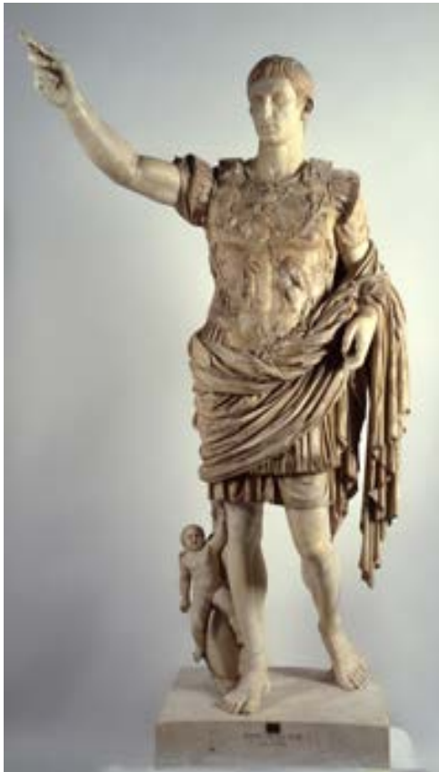
Augusto de Prima Porta Inv.2290 http://mv.vatican.va/4_ES/pages/x-Schede/MBNs/MBNs_Salao1_01.html

Horacio, complaciente, escribía que la Grecia cautiva capturó a su vez a su fiero vencedor y llevó las artes al agreste Lacio. 1 La cultura grecohelenística llega nuevamente a Roma para seducir.