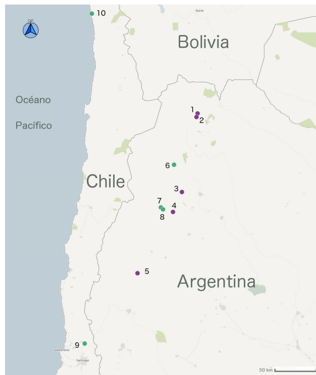
Figura 1. Mapa del Noroeste argentino, indicando procedencia de las muestras de estudio y de otros sitios mencionados con evidencia de cerámicas metalúrgicas en los Andes del Sur: 1. Huacalera, 2. Tilcara, 3. Rincón Chico, 4. Potrero-Chaquiago, 5. área de Jáchal; 6. Tacuil, 7. Campo de Carrizal, 8. Quillay, 9. Los Nogales, 10. valle de Camarones.

del Museo Etnográfico “Juan Bautista Ambrosetti” de Buenos Aires (colección Casanova, número catálogo 28293) y no hay precisiones acerca de sus condiciones de hallazgo. Se conocen pequeñas campanas dobladas y con badajo de este sitio, que fueron asignadas a inicios del periodo de Desarrollos Regionales (ca. 1100-1280 DC) (Gudemos 1998). El molde de disco del sitio conglomerado de Tilcara (M2), que abarca 9 hectáreas y cuenta con 500 unidades constructivas, se encontró dentro de la unidad habitacional 1, en el recinto 3.2, cuyas diversas estructuras estuvieron destinadas al trabajo artesanal y espacio habitacional (Tarragó y González 1998). Los diversos fechados contextualizan temporalmente a esta unidad desde mediados del periodo Tardío hasta fines del momento incaico (Otero y Ochoa 2011). Junto a este fragmento se registraron varios trozos de arcilla modelada pertenecientes a moldes de cera perdida, así como un fragmento de cobre nativo, una gota de cobre y cincel de cobre (Otero 2013).