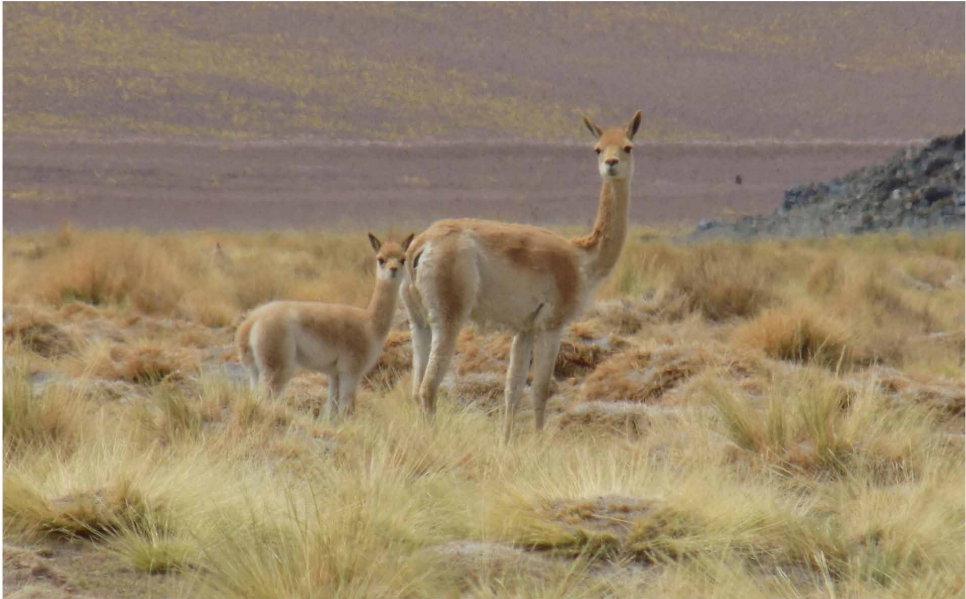
Figura 1. Vicuñas en Las Peladas (puna transicional de Chaschuil, Catamarca, 3.940 m s. n. m.)