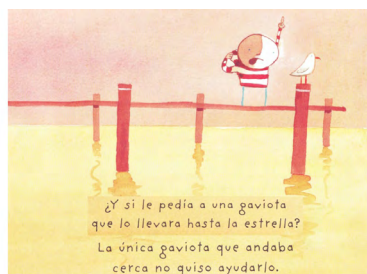
Imagen 3. Cómo atrapar una estrella (Jeffers, 2009) Versión digitalizada por docentes.