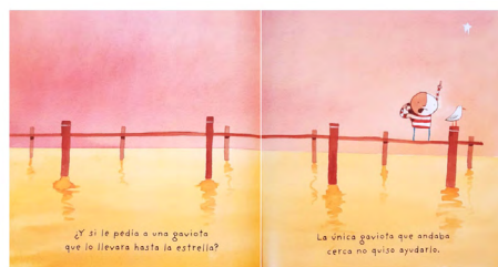
Imagen 4. Cómo atrapar una estrella (Jeffers, 2009) Versión impresa, consultada en biblioteca.