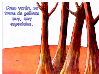
Imagen 11. Lola (Loufane, 2004). Versión digitalizada por docentes.