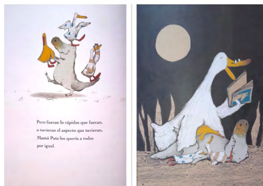
Imagen 2. Guyi Guyi (Chen, 2006). Versión impresa, consultada en biblioteca.

las categorías propuestas por Pérez Álvarez (2021), quien identifica y analiza las operaciones de apropiación y montaje editorial que se emplean en libros de artista, hicimos una descripción más precisa de las intervenciones de docentes a algunas obras que, por medio de fotografías o escaneos, llevaron a sus pantallas y a las que antes de compartir en formato PDF o PowerPoint alteraron con las siguientes operaciones: fragmentaciones, adhesiones, supresiones, sustituciones, compilaciones y/o combinaciones.