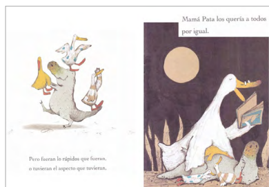
Imagen 1. Guyi Guyi (Chen, 2006). Versión digitalizada por docentes.