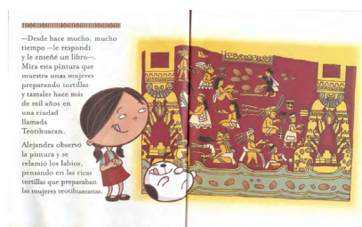
Imagen 13. Alejandra come la lluvia (Navarrete, Mireles y Varela, 2004). Versión digitalizada por docentes, página sin sustitución.