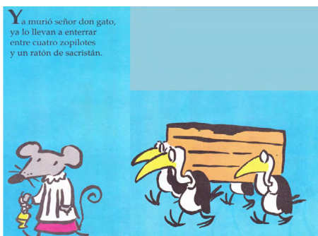
Imagen 15. El señor don gato (Corona y Trino, 1992). Versión digitalizada por docentes.