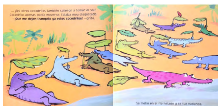
Imagen 10. Los cocodrilos copiones (Bedford y Bolam, 2008). Versión impresa, consultada en biblioteca.