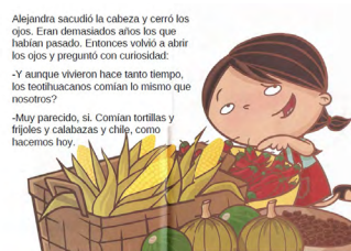
Imagen 14. Alejandra come la lluvia (Navarrete, Mireles y Varela, 2004). Versión digitalizada por docentes, página con texto sustituido.

Una situación similar la vemos en el siguiente ejemplo, pero a diferencia de la obra anterior en la que los textos de todas las páginas son sustituidos, en Alejandra come la lluvia (Navarrete, Mireles y Varela, 2004) la sustitución ocurre solo en algunas páginas (Imagen 13 y 14).