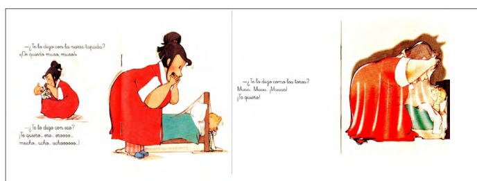
Imagen 16. Te quiero un montón (Chandro y Torcida, 2004). Versión digitalizada por docentes. Visualización de la obra digitalizada eligiendo la opción "vista de dos páginas" desde un lector de PDF.

Sobre la eliminación de páginas. Haber evidenciado la ausencia de páginas en las obras digitalizadas nos ha llevado a pensar en lo que los y las docentes priorizan de una obra de literatura infantil, y es que en ningún caso se suprimieron bloques de texto, sino que fueron espacios en blanco e ilustraciones las que fueron prescindibles. Si bien cuando estamos frente a un libro ilustrado lo relevante tiende a ser el texto, en los libros álbum, no hay jerarquías entre los elementos que ocupan el espacio gráfico, pues entre todos se construye el sentido de la obra (Arizpe, 2005; Guerrero Guadarrama, 2020) y la manipulación de alguno puede romper las intenciones literarias detrás de su construcción semiótica, por ejemplo, se puede limitar el acceso a los espacios de indeterminación que los autores-ilustradores crean a fin de ser llenados por las interpretaciones de los lectores (Iser, 1980). Esto, además nos hace pensar en el posible uso que docentes hacen de los libros de literatura infantil, pues con la preferencia por los textos podemos inferir que en la interacción con este tipo de obras lo que se promueve es la lectura, pero no la observación, ni la integración iconotextual.