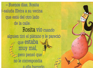
Imagen 7. ¿A quién le toca? (Peyrón y Gallo, 2008) Versión digitalizada por docentes.