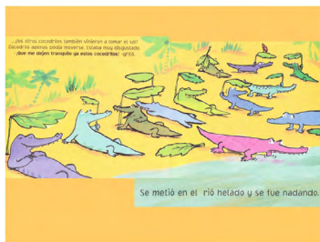
Imagen 9. Los cocodrilos copiones (Bedford y Bolam, 2008). Versión digitalizada por docentes.