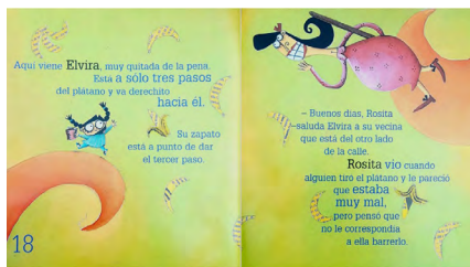
Imagen 8. ¿A quién le toca? (Peyrón y Gallo, 2008) Versión impresa, consultada en biblioteca.