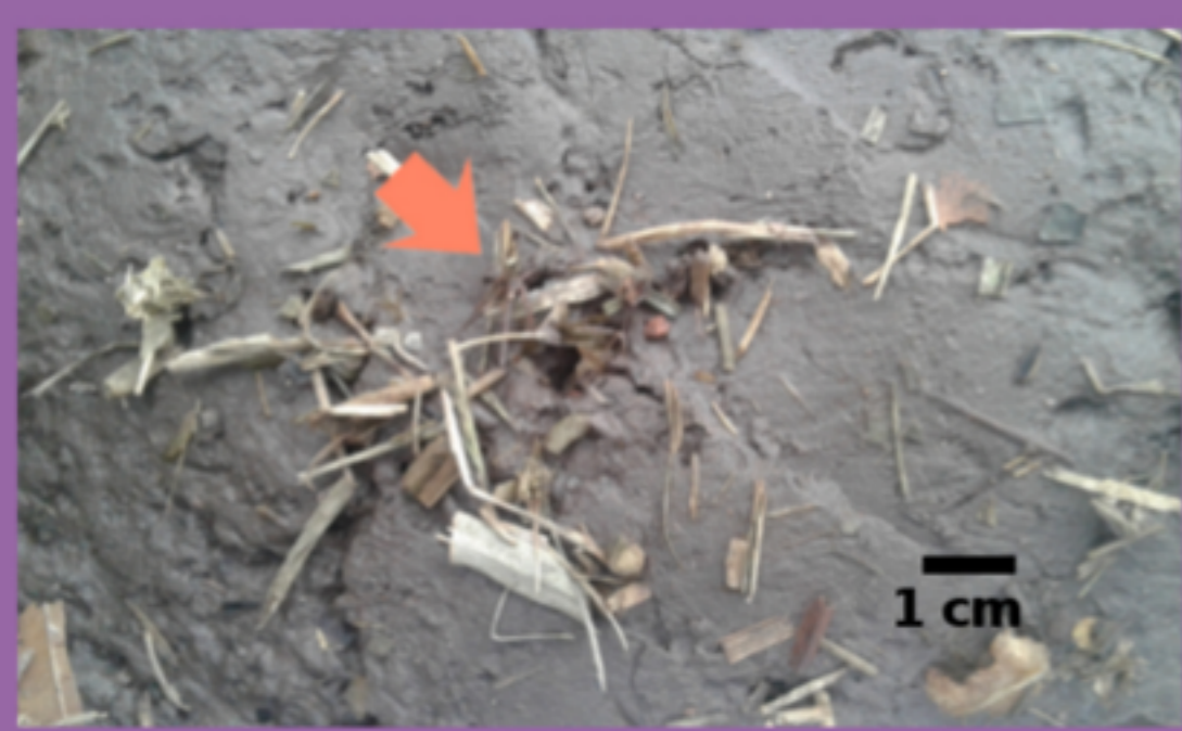
Figura 3. Agrupamiento de elementos vegetales (cairn) alrededor de boca de túnel, indicada por flecha.