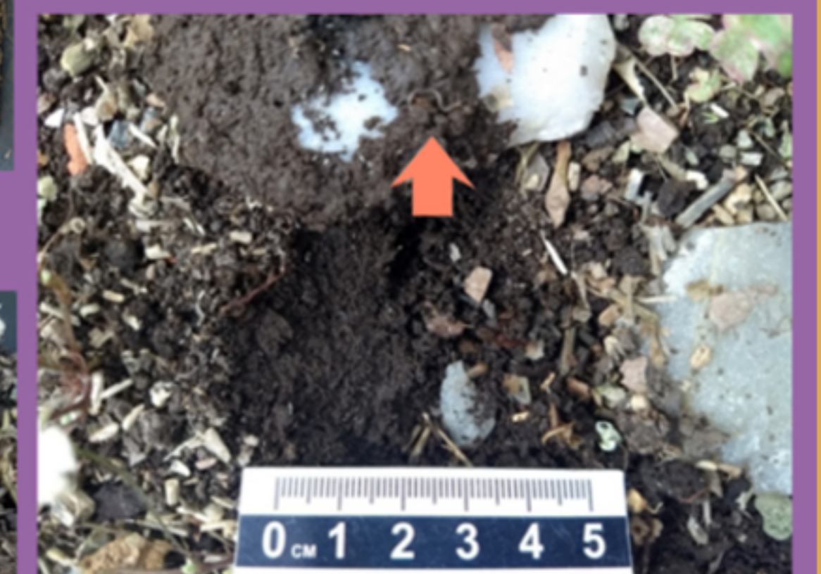
Figura 8. Ítem lítico pequeño hallado debajo de uno grande. Se señala un pequeño ciempiés.