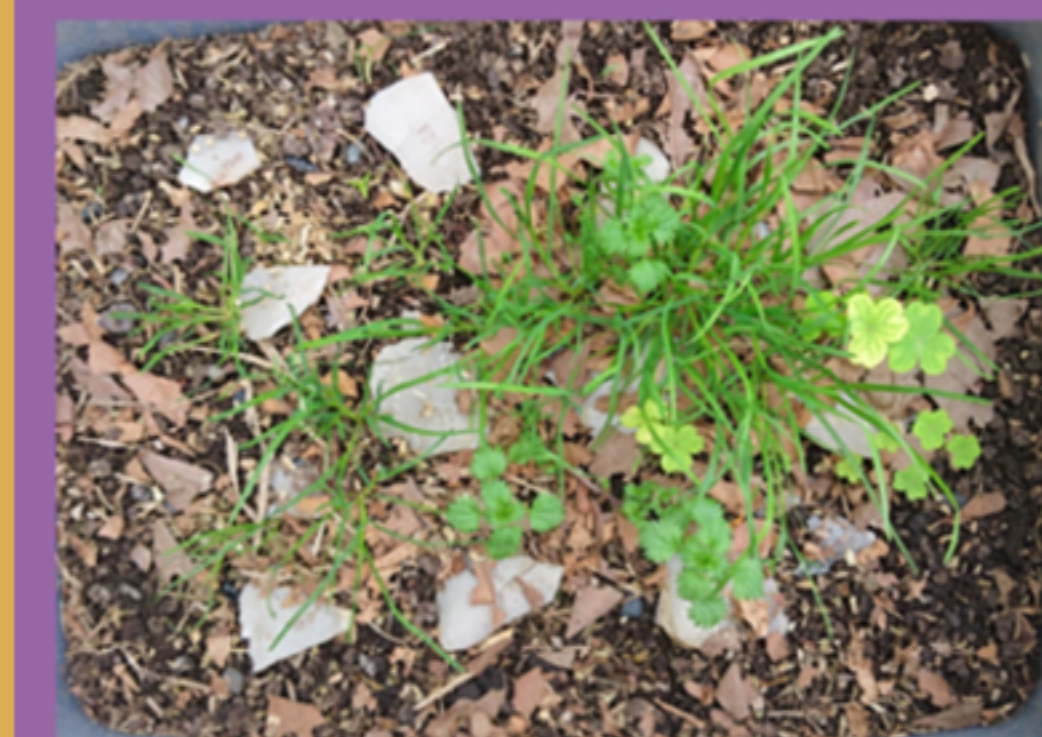
Figura 7. Vegetación.

Con respecto a los materiales, del Contenedor A se destaca el registro de huesos expuestos en la superficie, semi-enterrados y enterrados hasta 5 cm de profundidad. Algunos, como las costillas, se mantuvieron articulados. Al contrario, elementos más pequeños, como las placas dérmicas de la cola, migraron por los laterales del contenedor hacia su base (Escosteguy y Fernandez 2017). En cuanto al material lítico, a partir del séptimo mes se registró hundimiento progresivo y, en algunos casos, desplazamientos horizontales y cambios de posición (Fig. 8 y 9). El material cerámico, por su parte, no mostró cambios significativos.