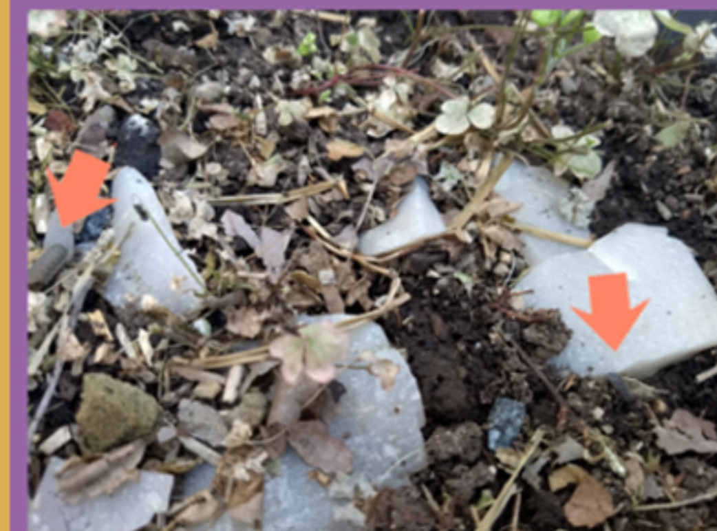
Figura 9. Elementos líticos agrupados y parcialmente superpuestos. Se señalan un bicho bolita muerto (izquierda) y uno vivo (derecha).