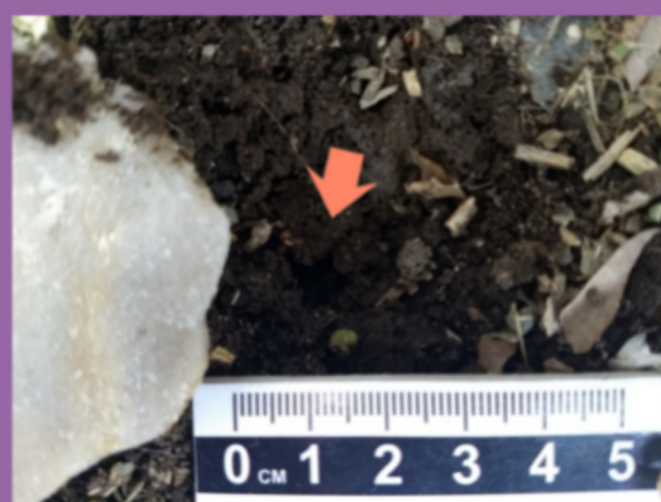
Figura 4. Boca de túnel debajo de ítem lítico.