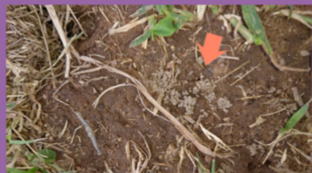
Figura 5. Grumos fecales (casts).