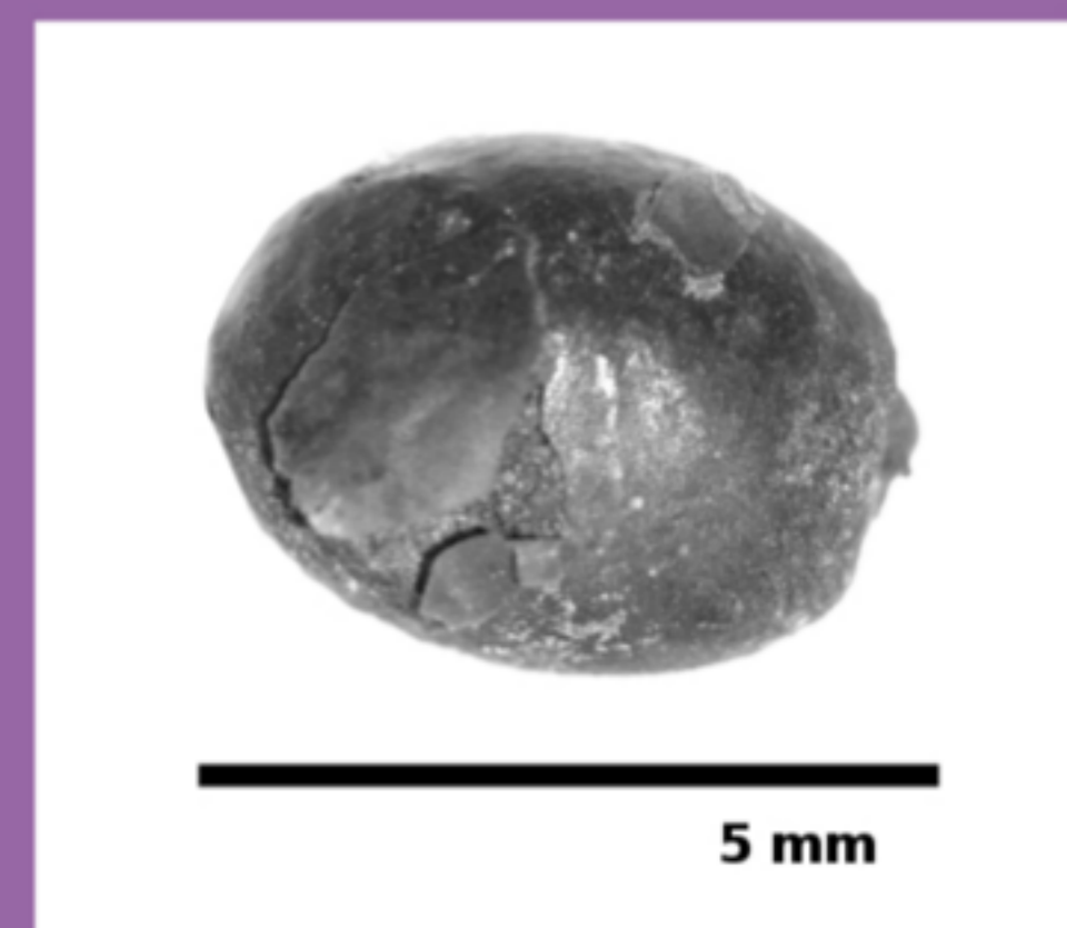
Figura 6. Cocón (lupa binocular 15X).