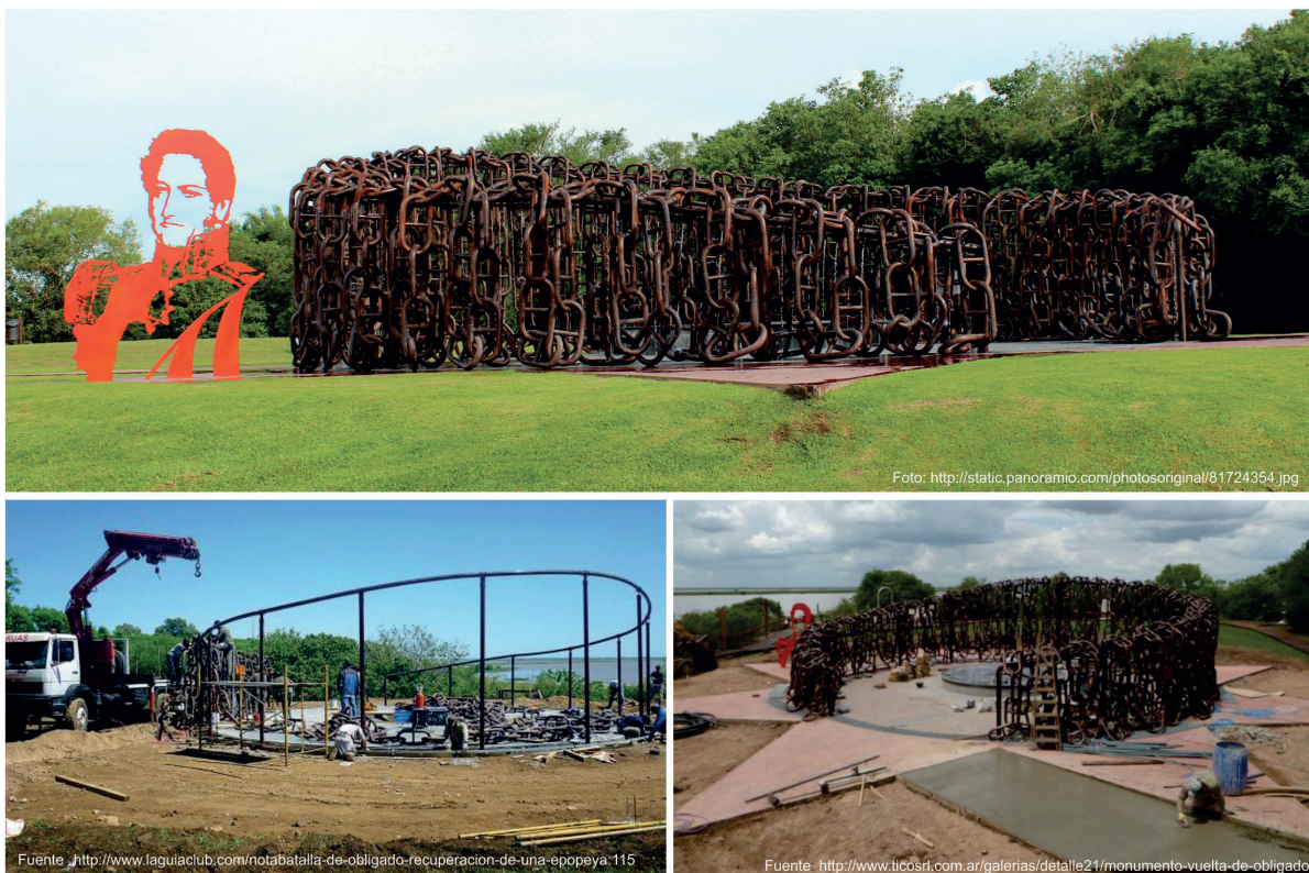
Figura 5. Monumento de conmemoración de la batalla de Vuelta de Obligado instalado en el año 2010.

elemento importante para el desarrollo y visibilidad del paraje. Por otro lado, se hicieron escuchar las perspectivas que señalaban los riesgos ambientales que esta estructura podría generar: deterioro de la flora y fauna nativa y desmoronamientos de la barranca. La municipalidad de San Pedro oficialmente expresó su desacuerdo debido a que el monumento fue planificado a nivel nacional sin participar a las autoridades municipales. En este contexto, el equipo de arqueología fue convocado por la Universidad de San Martín para realizar la evaluación de impacto arqueológico. Las recomendaciones de dicho estudio propusieron un cambio de traza y una serie de acciones para desplegar durante la realización de la obra en caso de producirse hallazgos eventuales (Ramos 2010). A medida que las diferentes posiciones fueron adquiriendo visibilidad pública se generó un ámbito político común de disputa, en el que los actores e instituciones vinculadas se identificaron de acuerdo con posturas polarizadas en torno a hacer o no el monumento. De este modo, el conflicto generó una escena y una temporalidad en la que se intercambiaron los argumentos y, en este