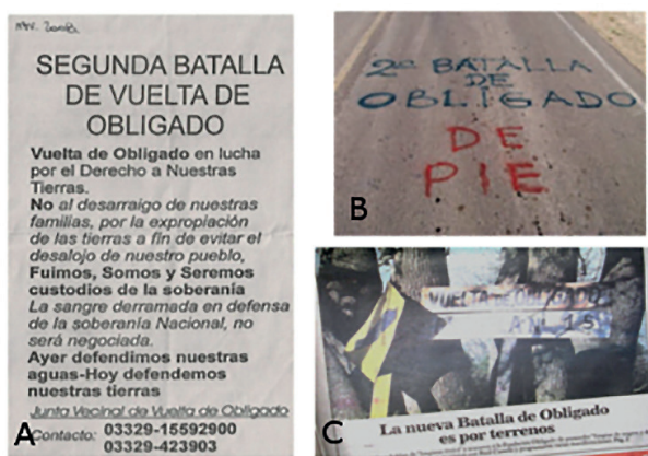
Figura 3. Movimiento vecinal por los terrenos. A) Folleto distribuido durante noviembre de 2008. B) Inscripción en la calle de entrada al pueblo (nov. 2008). C) Titular en Baradero te informa.com (7 de abril de 2011).

con los conflictos derivados por la propiedad de las tierras. Estos movimientos favorecieron la consolidación de la participación política a la vez que aumentaron la distinción social: entre los pobladores con título de propiedad y ocupantes de hecho; entre los pobladores que siempre residieron en Vuelta de Obligado y envían a sus hijos a la escuela local y aquellos que en los últimos años construyeron sus segundas viviendas y visitan el paraje principalmente durante los fines de semana (Salerno 2014). La organización local en defensa de la tierra se desplegó bajo el lema “la Segunda Batalla de Obligado”, lo que promovió procesos de identificación con el paraje y su historia así como fuertes redes de reciprocidad entre los vecinos (Figura 3). De este modo, la batalla decimonónica se retomó en tanto símbolo que podría identificar a la historia y el presente del paraje: un lugar donde sus pobladores defienden la tierra.