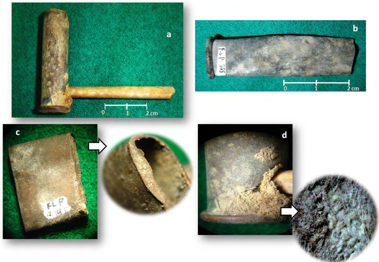
Figura 2. Características de la pipa artesanal hallada en FLP: a- artefacto completo; b- vainas C43 de armas Remington Patria sin la bala de plomo; c-corte de la vaina realizado en bisel con formón; y d- tela utilizada para asegurar la inserción del tubo de hueso al orificio de la vaina.

corte biselado (Figura 2). El fragmento inferior de la vaina fue utilizado como hornillo y con el fin de adosarle una boquilla se le efectuó un orificio cercano a la base o rim. La boquilla fue confeccionada con una diáfisis de hueso largo, que probablemente corresponde a una tibia de Ardea sp. (garza blanca) y que se unió al cuerpo de la vaina utilizando un fragmento de tela que aún se encuentra adherida a la abertura y a un sector de la pared de la vaina. Es posible que al encender el hornillo resultara difícil sostener la pieza con la mano por la elevada temperatura transmitida a través del metal. Por este motivo, parte de la tela que sellaba la unión del metal con el hueso habría sido utilizada como aislante. Asimismo, en el registro arqueológico de FLP se recuperaron dos fragmentos correspondientes a la porción superior de dos vainas recortadas, coincidentes con el tipo de rastro de corte que se observa en el borde superior de la pipa y un fragmento de tibia de Ardea sp. con cortes transversales similares a los observados en el tubo de la pipa. De acuerdo con ello, es probable que la pipa recuperada en forma completa no sea la única pieza de ese tipo y que los fragmentos descartados indiquen la presencia de un número mínimo de al menos dos pipas similares.