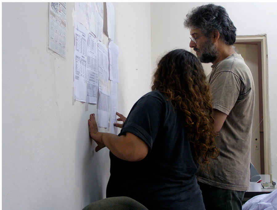
Imagen 1. Fotografía taller textil

El tipo de producción exige cumplir horarios diariamente en forma pautada porque se atiende al público. Se planteó como desafío que todos sostuvieran en forma continua, con disciplina y con conciencia de equipo, el trabajo diario. Se evaluó que el grupo tenía participantes para quienes una cultura con horarios fijos y pautas de responsabilidad sobre los procesos frente a terceros debía aún aprenderse, por lo que se decidió desarrollar: