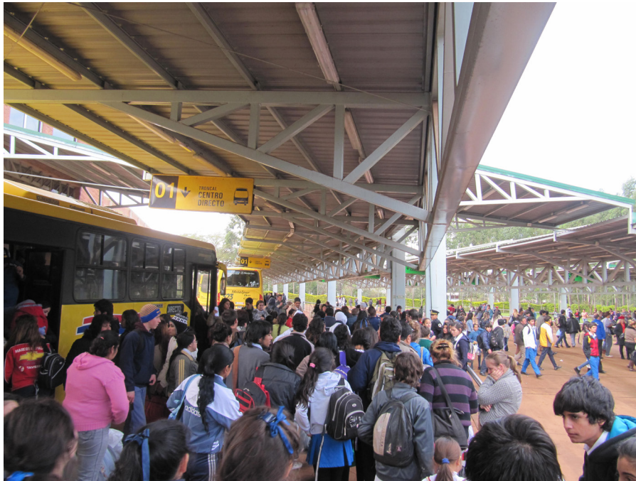
Figura 3. Foto de la Estación de Transferencia Campus-UNaM.

lo único que ha logrado es "reordenar la demanda masiva de pasajeros afluentes de los barrios periféricos...ej.: Garupá, Itaembé Mini, Villa Bonita..., hacia distintos destinos de la ciudad" (pasajera del Barrio 360 viviendas, Garupá).