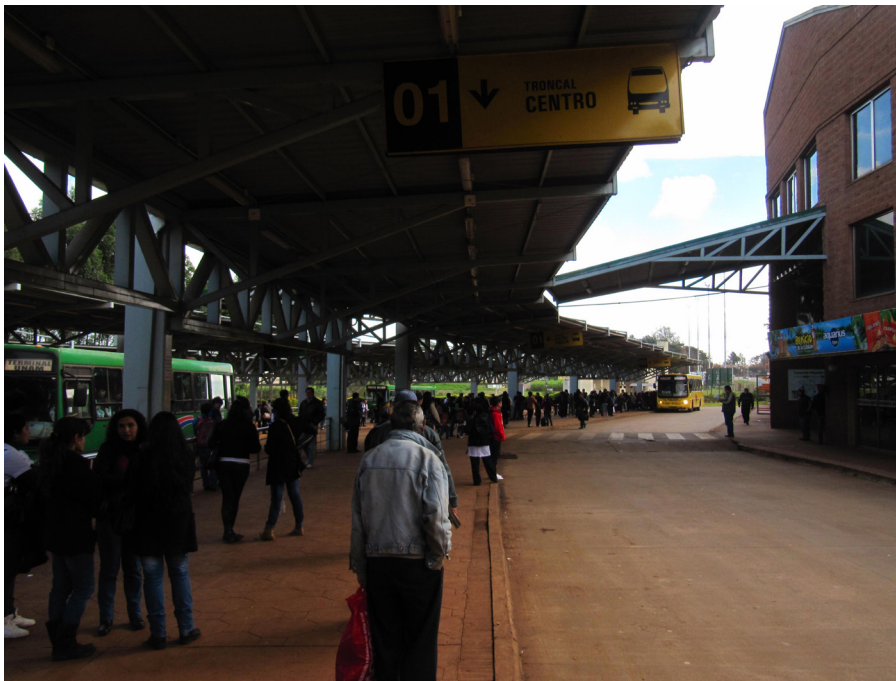
Figura 4. Foto de la Estación de Transferencia Campus-UNaM.

dos agentes para controlar el ingreso y el egreso al predio, y por consiguiente que los pasajeros ingresen por la puerta principal abonando su pasaje. Sin tener en cuenta la seguridad de la gente. (16/10/2013)