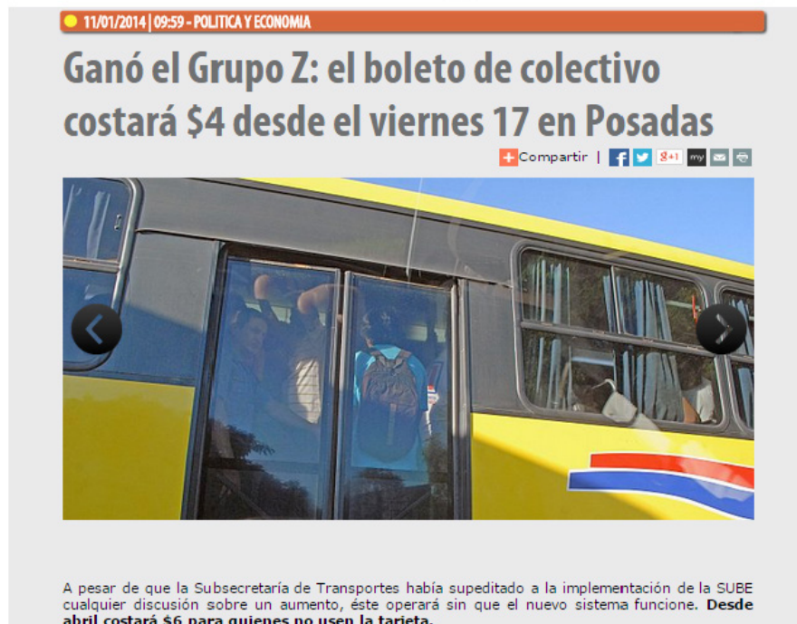
Figura 7. Nota periodística para tratar el aumento de boleto.

El sistema de transporte no cambió nada. Sigue siendo el mismo. Los choferes están presionados para realizar sus recorridos en cierto tiempo, y cuando no llegan cometen infracciones, aumentan la velocidad, pasan los semáforos en rojo, saltan paradas. Además hay líneas como la del 03 y el 27 que el chofer toma mate, contesta su celular y manda mensajitos...”, “...los choferes manejan, cobran el boleto además tienen que controlar lo que pasa en el colectivo, tienen que poner los tickets electrónicos u otra persona que cobre el pasaje”. “A mí la otra vez me apretaron con la puerta cuando quise subir, la empresa dice que los pasajeros están todos asegurados cuando están adentro del colectivo, pero si no pudiste entrar como me pasó a mí y te caes. ¿Quién te cubre?”