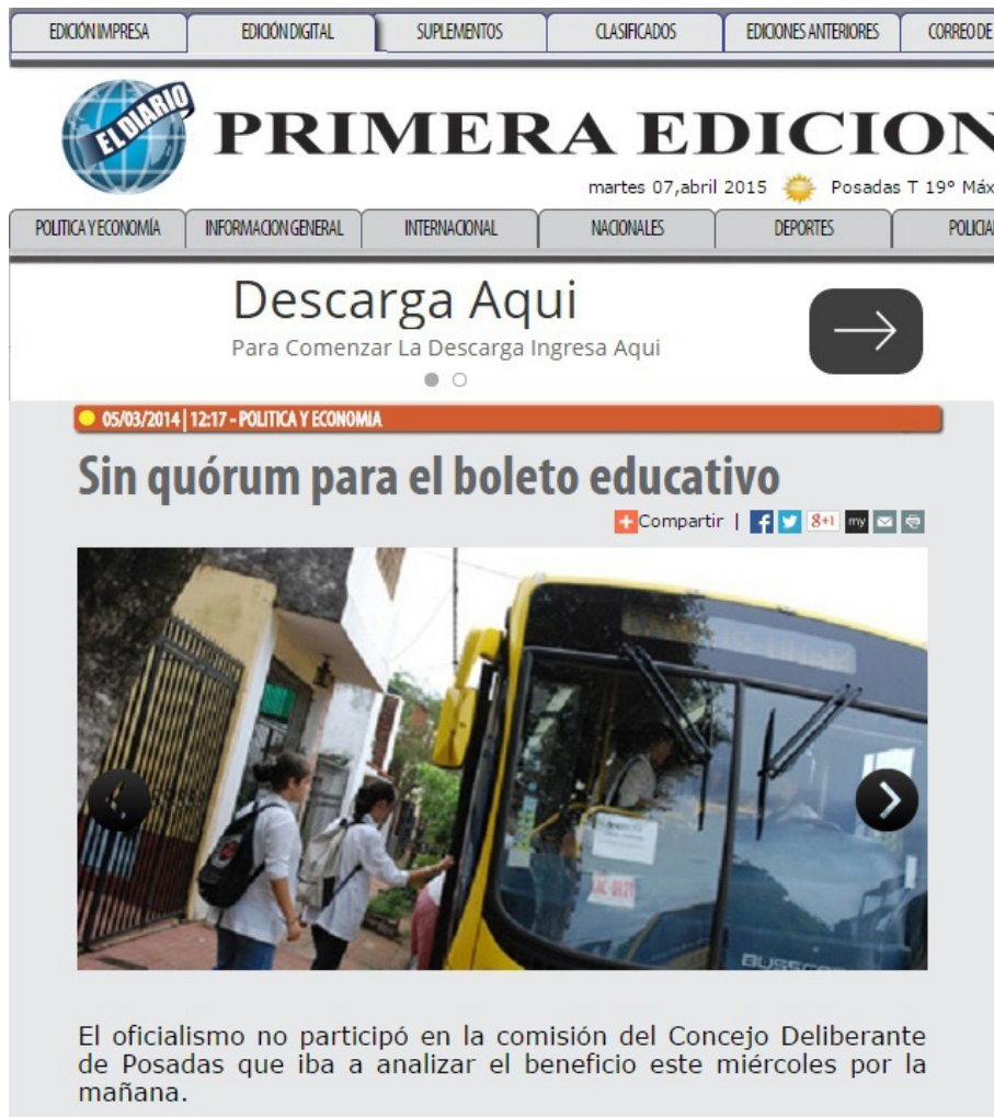
Figura 9. Nota Periodística para tratar el boleto educativo.

La masiva y ruidosa columna de manifestantes muchos de los cuales portaban pancartas y carteles con duras consignas contra la prestataria, pero sobre todo contra las autoridades políticas que autorizaron el aumento partió pasadas las 8:30h del Mástil de las avenidas Mitre y Uruguay y luego se desplazaron por el microcentro capitalino, visitando varias sedes oficiales, antes de desembocar en la Casa de Gobierno y, posteriormente, se dirigieron a la Municipalidad de Posadas, donde entregaron un petitorio con alrededor de 15 mil firmas en el que se pidió la marcha atrás de la suba tarifaria y la celebración de las correspondientes audiencias públicas.