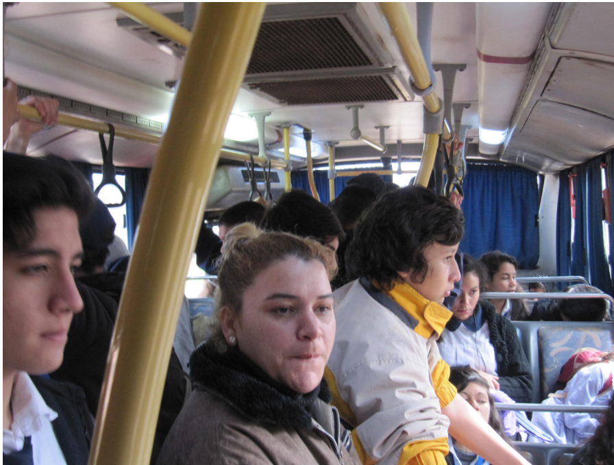
Figura 6. Fotos de pasajeros dentro del "Gusano".

servicio Integrado Metropolitano de pasajeros para detectar si realmente existen pérdidas, como argumentan los empresarios, que justifiquen el aumento del boleto. Este pedido fue llevado a cabo por miembros de partidos y agrupaciones como la Unión Cívica Radical, Juventud Radical, Asociación Trabajadores del Estado, Central de Trabajadores Argentinos, Corriente Clasista y Combativa, Franja Morada, Partido Socialista, Trabajo y Progreso, la Administración Federal de Ingresos Públicos, (A.F.I.P), entre otros.