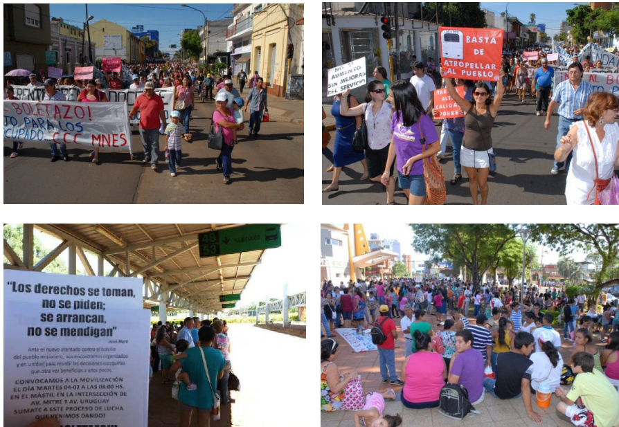
Figura 8. Fotos de las manifestaciones.

Isidro siempre son los más viejos. Se puede ver en este ejemplo como la exclusión no solo es económica, espacial sino que también se observa en los medios de transporte, el ómnibus más viejo de la empresa para los barrios más pobres y excluidos. De este modo se suman las desventajas para las poblaciones más empobrecidas.