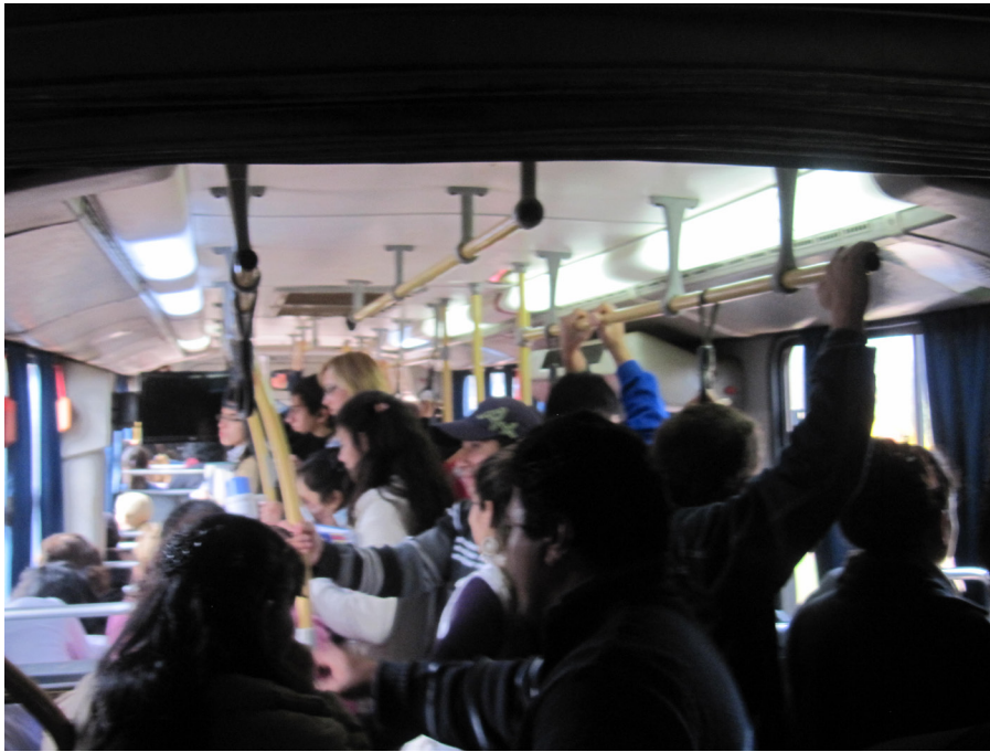
Figuras 5. Fotos de pasajeros dentro del "Gusano".

uniones entre algunos barrios que están cercanos. Pero muchos pasajeros se quejan de que no hay conexión entre los barrios que están en la zona sur con los de la zona suroeste de la ciudad. Deben irse hasta un punto, la rotonda, donde deben subirse a otro colectivo y pagar otro boleto. Como se dijo anteriormente todavía no se encuentra terminada la estación de transferencia "Quaranta" que cumpliría esta función mientras tanto las personas que viven en algunas zonas periféricas y quieren ir a otra zona periférica deben pagar dos pasajes.