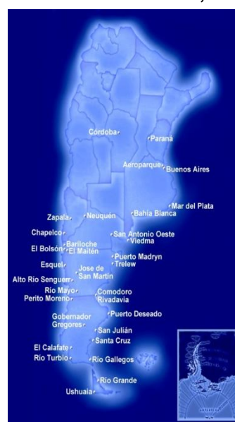
Figura 5. Variación del movimiento de Pasajeros en aeropuertos argentinos (1999-2007) (Nacional e Internacional) 16