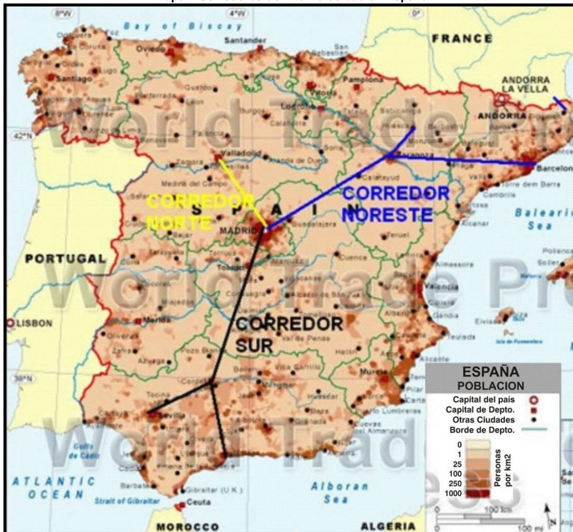
Mapa1. Corredores de Alta Velocidad en España

Fuente: Elaboración Propia. Para densidades de población se ha tomado el mapa base de World Trade Press 2007.