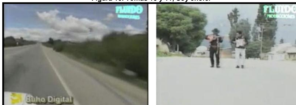
Figura 10. Tomas 10 y 11, Soy chofer