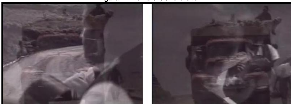
Figura 12. Toma 67, Chofercito