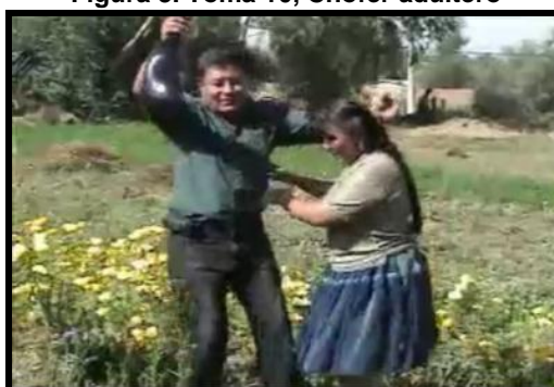
Figura 3. Toma 10, Chofer adultero