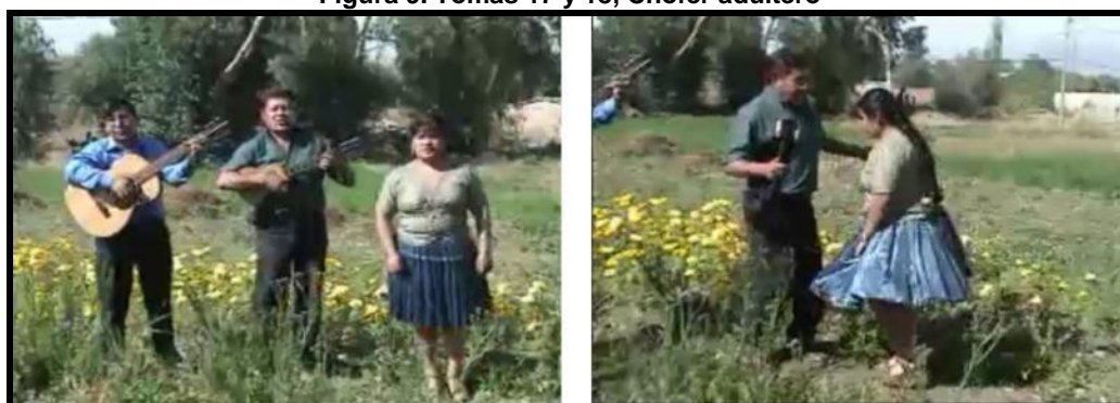
Figura 9. Tomas 17 y 18, Chofer adultero