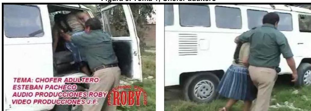
Figura 5. Toma 1, Chofer adúltero