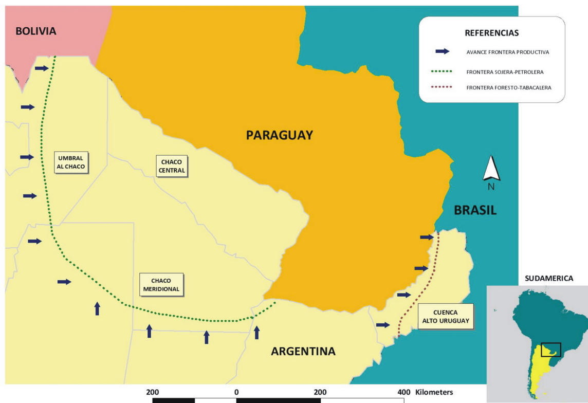
Figura 1. Avance de la frontera productiva en el Alto Uruguay y el Chaco Central.

ser definida como uno de estos sectores en curso de incorporación a la ecúmene” y distingue entre frentes pioneros y franjas pioneras, las cuales son los márgenes donde se diseñan “subecúmenes más o menos temporariamente colonizadas” (1966:974).