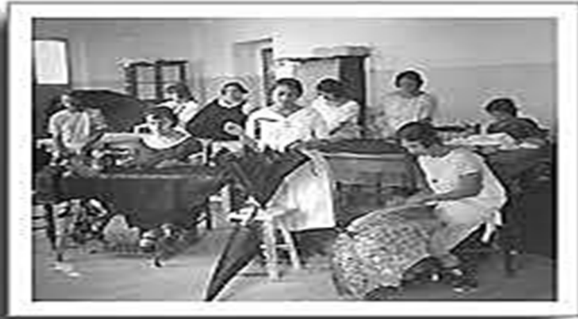
Clase de Paraguería en la Escuela Industrial Gabriela Mistral AHIPN