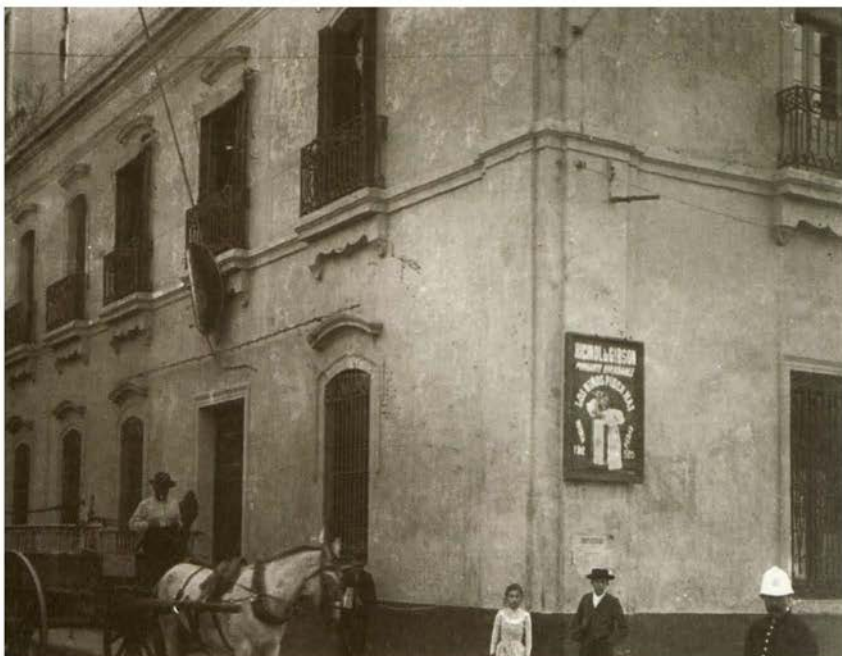
3. Antiguo edificio de la Biblioteca Pública de Buenos Aires