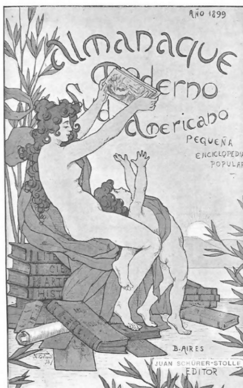
Imagen 1. Publicidad del Almanaque Moderno Sudamericano

fotografía y el grabado para ilustrar la enorme cantidad de información que brindaban en sus páginas (Parada, 2000), y junto a otras publicaciones del momento, parecía mantener algunas características que lo habían definido a principios de siglo: era usado por una amplia población de lectores por su fácil lectura y manipulación, su consulta rápida y su precio accesible (Parada, 2007: 76), sumando a ellos otra práctica, la conservación. Como parece indicarlo El Verdadero Calendario Perpetuo (1858) arreglado por Pablo E. Coni, los almanaques no se desechan. En este caso, el editor afirma que al permitirle a los lectores encontrar todas las fiestas, los exime de la necesidad de comprar uno nuevo cada año, a lo que añade que basta con una mirada para conocer la utilidad de este calendario que da noticias de los siglos pasados y venideros ( Verdadero Calendario Perpetuo , 1858: 3-4). Esto evidencia que estas obras no solo tenían múltiples lectores sino también múltiples lecturas, y aunque estas no eran intensivas, se podía volver a él cada vez que se necesitaba algo, desde releer un cuento, una rima, una crónica de viajes hasta relatos históricos, recetas de cocina o algún dato que ayudara en la vida cotidiana, de modo que se lo conservaba y se lo utilizaba habitualmente (Mosqueda, 2013: 124)... al parecer había lectores, pero ¿cómo encontrarlos?