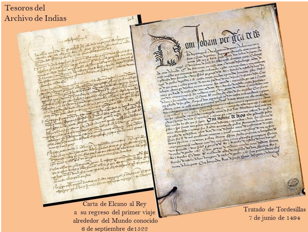
Carta de Elcano al Rey a su regreso del primer viaje alrededor del Mundo conocido 6 de septiembre de 1522