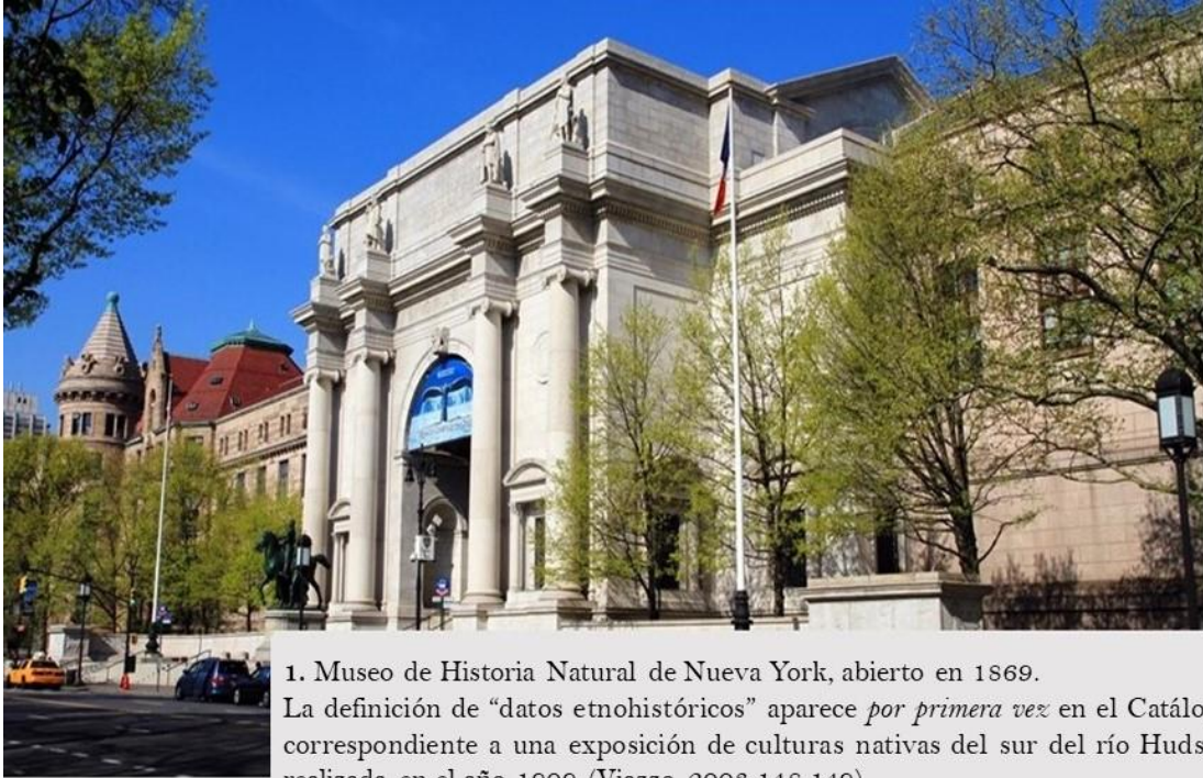
1. Museo de Historia Natural de Nueva York, abierto en 1869. La definición de “datos etnohistóricos” aparece por primera vez en el Catálogo correspondiente a una exposición de culturas nativas del sur del río Hudson realizada en el año 1909. (Viazzo 2003:148.149)

Resulta llamativo que los comentarios asentados en el Catálogo de 1909 ofrecieron las bases metodológicas que sustentan el método etnohistórico hasta el día de hoy.