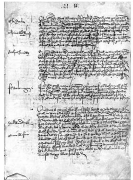
Documento con datos etnohistóricos. Licencia de embarque a la isla de Cuba y Puerto Rico

Habría que esperar a hasta 1954 y la fundación de la revista “ Ethnohistory ” por la American Indian Ethnohistorian Conference para recuperar el método etnohistórico. Un grupo de antropólogos norteamericanos fue empujado a asociarse en medio de la controversia legal desencadenada por procesos judiciales para reivindicar la validez de los derechos indígenas de propiedad sobre las tierras que ocupaban.