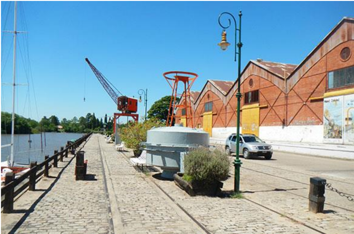
Foto 5. Vista panorámica, Gualeguaychú.