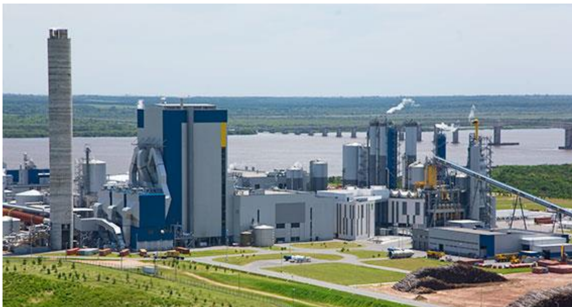
Foto 2 Pastera UPM localizada en la ciudad de Fran Bentos (Uruguay).