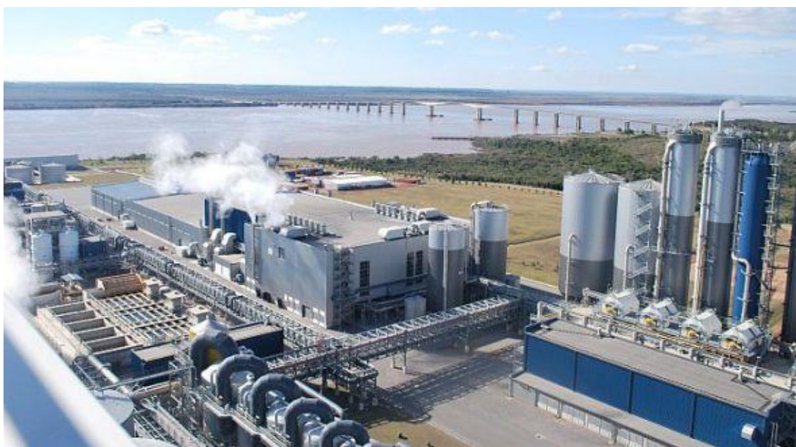
Foto 1: Pastera UPM localizada en la ciudad de Fran Bentos (Uruguay).

La ACAG nunca quiso dialogar con el Gobierno uruguayo ni tampoco con la opinión pública uruguaya. Según Reboratti (2010) realizaron una acción de protesta en una de las principales plazas de Montevideo, pero tuvieron un resultado negativo: el pueblo los expulsó violentamente.