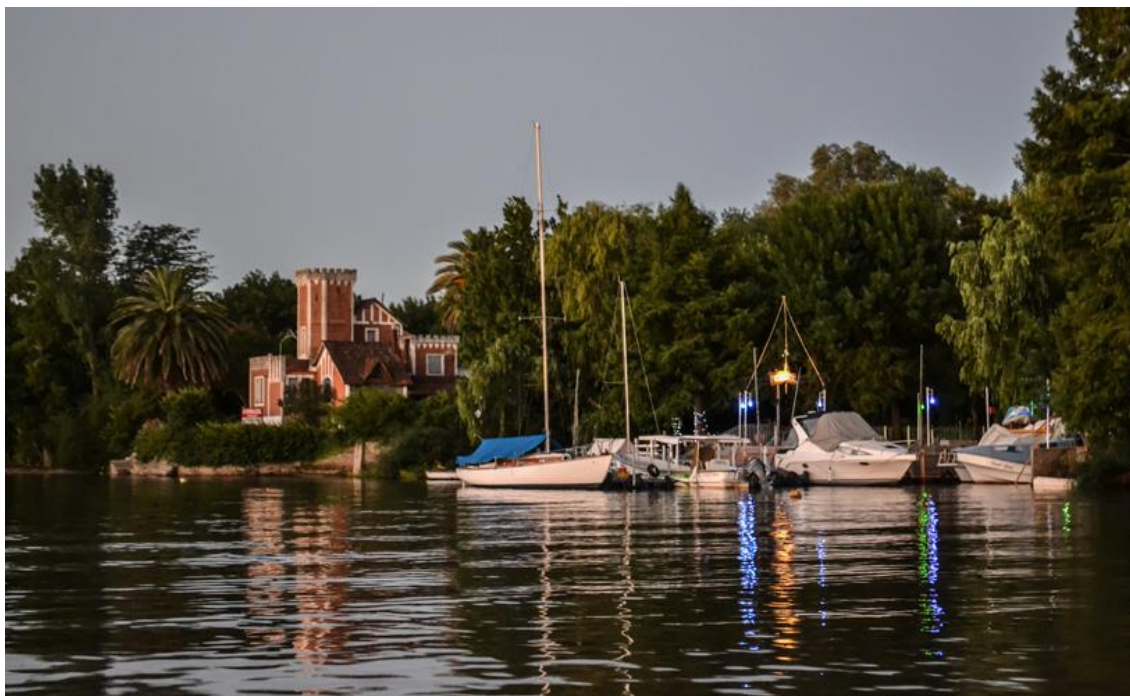
Foto 3. Isla Libertad de Gualeguaychú, Provincia Entre Ríos.

Además de poseer ese cruce estratégico, Gualeguaychú es una ciudad que posee un atractivo paisaje natural por su principal recurso el río que lleva su mismo nombre y a que atraviesa su ciudad (Ver: foto 5). En esta ciudad se destaca una gran cantidad de complejos culturales, sitios históricos, balnearios como así también varias actividades culturales y festivas en donde sobresale el denominado: 'Carnaval del País' que es un desfile de Carrozas y Feria de Colectividades, De Mahieu et al. (2003).