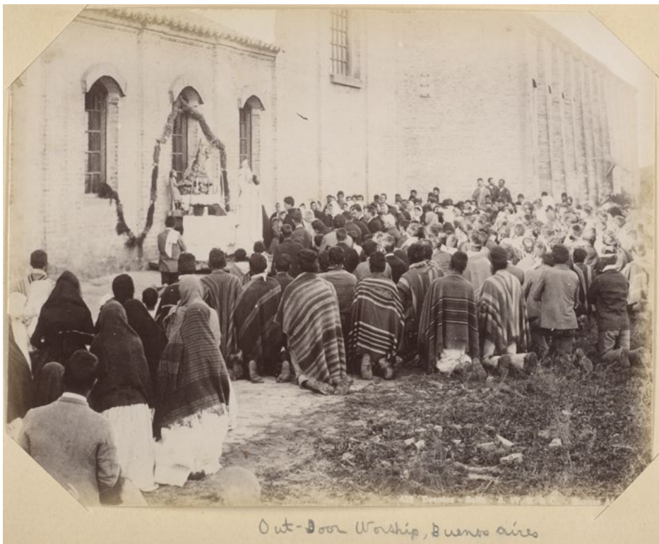
Figura 1. Devotos, Salta - Out door worship , Buenos Aires. Álbum 44 - Image Archive - Latin American Library - Tulane University

El álbum se centra principalmente en la ciudad de Buenos Aires y alrededores como centro urbano (Tabla 1). Las temáticas pueden agruparse en: arquitectura edilicia (teatros, iglesias, cementerios), diseño de espacios públicos (parques), el puerto y los inmigrantes, calles y su vida social y las nuevas estaciones ferroviarias. Le sigue en importancia el área pampeana. Dos fotos representan al Norte del país. Una, “Devotos” (Figura 1), fue tomada, de acuerdo al epígrafe, en Salta. La otra imagen no tiene hoy rastros de epígrafe por lo cual es difícil adscribirla a algún lugar específico. Muestra una calle con un pavimento de piedras grandes y casas de planta baja. A la distancia se observa gente mestiza. Finalmente debemos mencionar que la primera y la última fotografía, procedentes posiblemente de Brasil, son de dimensiones levemente mayores y actualmente no presentan leyendas mecanografiadas. La última lleva escrito a mano “Río de Janeiro”. Estas fotografías habrían venido originalmente en el álbum puesto que las hojas que sostienen