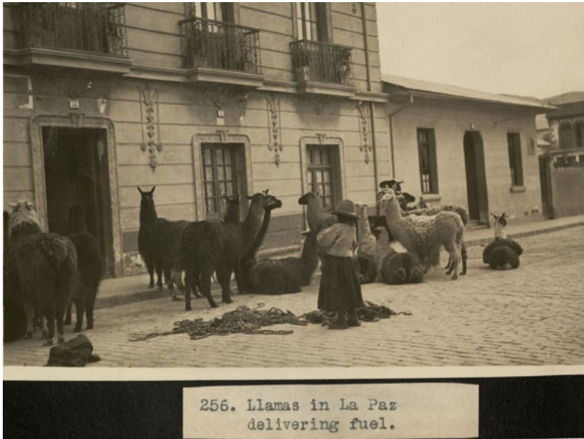
Figura 5. Llamas en La Paz. Llamas in La Paz delivering fuel.