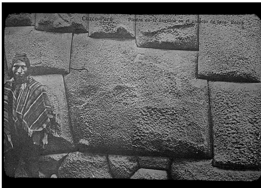
Figura 3. Piedra de 12 ángulos en el palacio de Inca. Inca Brickwork , Peru.

no hay conexión entre su actitud y el lugar, que funcionan más como escala humana para aportar idea de las dimensiones antes que tener connotaciones identitarias o de clase.