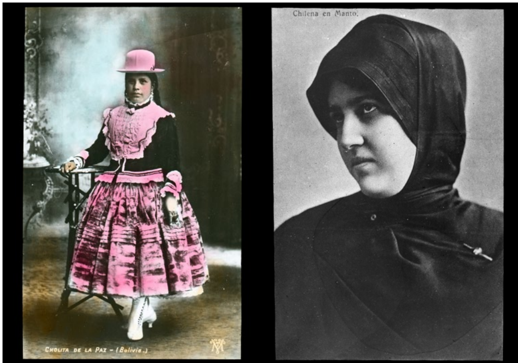
Figura 4.a: Cholita de La Paz, Bolivia; b: Chilena en manto.

de retrato, que buscaban mostrar las cualidades físicas o morales de las personas fotografiadas. Su ropa y pose la aleja totalmente de las cholos e indias fotografiadas en el resto de las imágenes. De acuerdo con Cheng (2015), con el inicio del período republicano al inicio del siglo XIX ciertas medidas políticas ejercieron presión sobre las formas comunales de mantención de las tierras en Bolivia. Esto llevó al movimiento de grupos indígenas a la ciudad y a una expansión de la clase social de los cholos, que comenzaron a ser parte esencial de la economía y vida social de las diferentes ciudades de este país. La chola comienza a adquirir una identidad propia sobre el cholo, distinguida tanto por el grupo de inmigrantes llegados e instalados en las periferias de las ciudades como por la sociedad blanca (Cheng 2015). Para los criollos, la imagen de la chola elegante jugó un importante rol en el proceso de construcción del sentido de nación, representando el origen rural indígena y el estilo de vida urbano buscado por la modernización, sin embargo, claramente local y americano. La “Cholita de La Paz, Bolivia” busca representar la imagen de la chola con sus típicas botas de media caña, bombín tipo borsalino, pollera y blusa con encaje del departamento de La Paz dado que cada