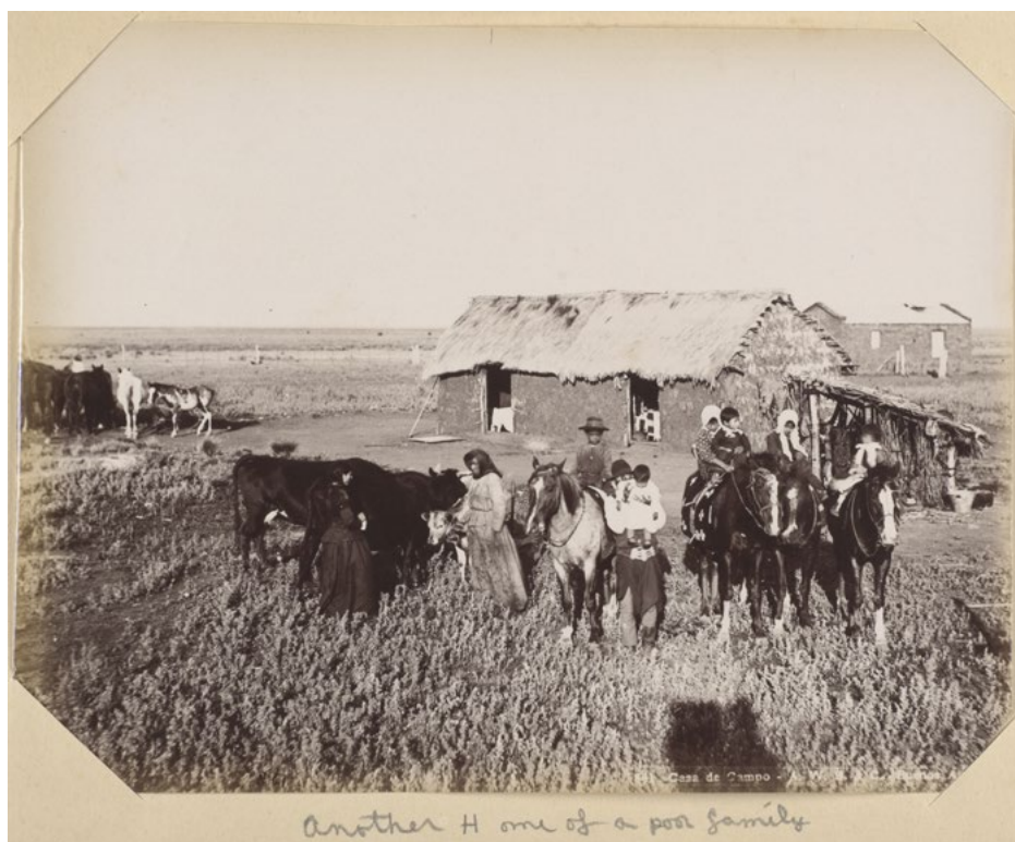
Figura 2. Casa de campo - Another home of a poor family . Álbum 44 - Image Archive - Latin American Library - Tulane University

En lo que hace a las imágenes con doble anotación, tres de los cuatro casos involucran una corrección de la información previa. Es así que la "Plaza Constitución" fue primero entendida como "University of Buenos Aires" para luego ser tachado y reemplazado por "Southern R.R Station", lo cual entendemos como información precisa aunque diferente a su traducción literal. De forma similar "Quinta/ Sta. Felicitas" es interpretada inicialmente como "Residence and Cathedral, Buenos Aires" para ser corregida la palabra Catedral por "Santa Felicitas". Una