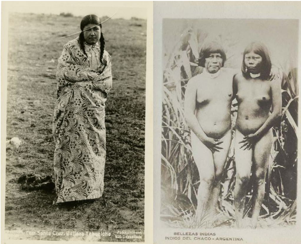
Figura 7.a: Terr. Santa Cruz. Belleza Tehuelche. Colección 39(3) - Image Archive - Latin American Library - Tulane University; 7.b: Indias Matacos. Jacobo Peuser editor (sin fecha)

cuerpos desnudos (Masotta 2003), en ocasiones con una mano próxima a los genitales. Evidentemente las mujeres en el Chaco usaban prendas más livianas pero eso no es razón suficiente para explicar estas fotografías. Posiblemente sea la represión sobre el erotismo y la sexualidad, lo que lleva a camuflar la sensualidad bajo figuras de cuerpos indígenas (Carreño 2002). La comparación de éstas con otras similares que circulaban aproximadamente para la misma época muestra esta tendencia. De hecho existen otras fotografías cuyo contenido erótico es más fuerte (Figura 7.b).