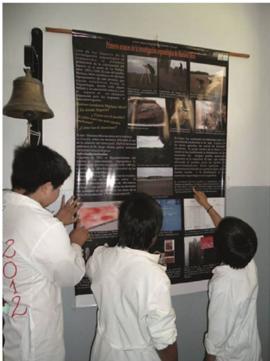
Figura 3. Poster con información de los trabajos arqueológicos realizados en el sitio Mariano Miró expuestos en la Municipalidad de Hilario Lagos.

El 19 de Octubre de 2012, se organizó una charla pública en el Cine-Teatro de Hilario Lagos. Allí asistieron alumnos de las escuelas y público en general. Esta actividad fue declarada de interés municipal por el Intendente de H. Lagos (Resolución 48/2012). Se desarrollaron además trípticos que fueron repartidos a la comunidad y pósteres que fueron colgados en la municipalidad y en la escuelita rural cercana a Mariano Miró (Figura 3). En ambos se detalla la labor arqueológica realizada.