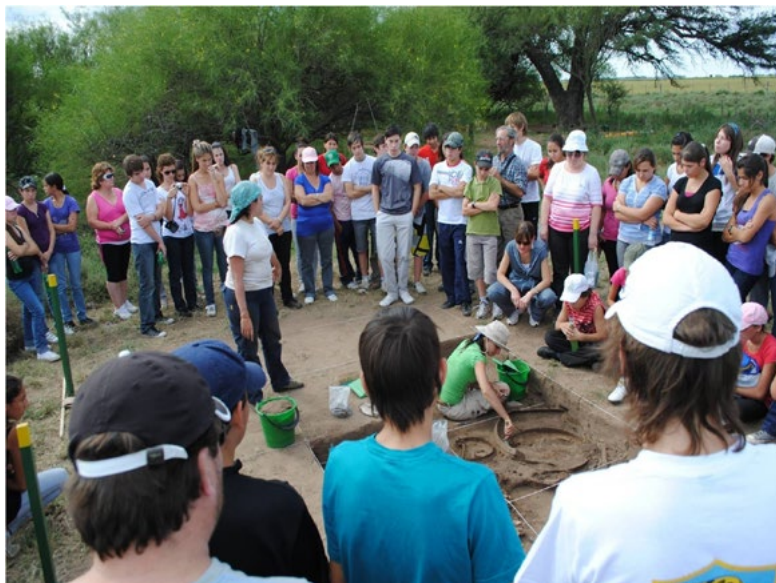
Figura 2. Visita de la comunidad educativa de Alta Italia al sitio arqueológico Posta El Caldén en Marzo de 2011.

(Devine en Marsh y Stoker 1997:146). La muestra estuvo compuesta por individuos de ambos sexos con un rango etario comprendido a partir de los 70 años. En ellas se indagaron sobre las relaciones establecidas con la materialidad y espacialidad a partir de los recuerdos transmitidos por sus padres y abuelos.