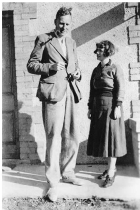
Gregory Bateson y Margaret Mead en 1930

Mientras realizaba su trabajo de campo en el Pacífico, tuvo oportunidad de conocer a la reconocida antropóloga Margaret Mead, con quien posteriormente se casó e iniciaron juntos un innovador trabajo de campo en Bali.