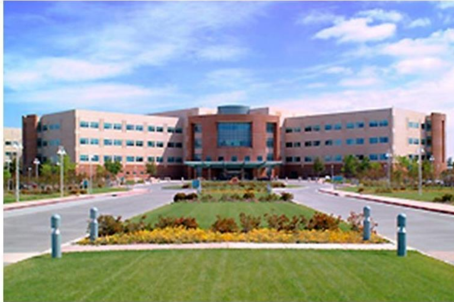
Hospital de Veteranos (Palo Alto, California) 1949-59: Equipo interdisciplinario de investigación psiquiátrica A cargo del antropólogo Gregory Bateson