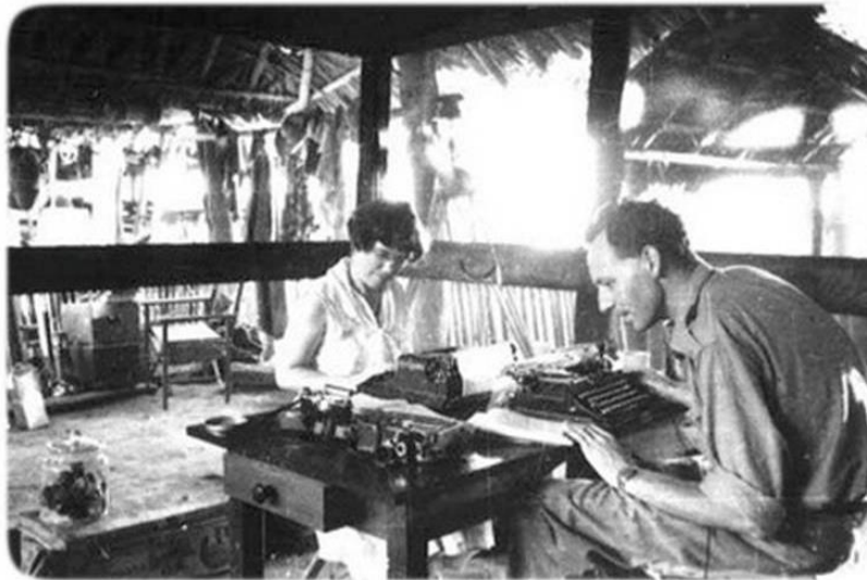
Gregory Bateson y Margaret Mead en Bali