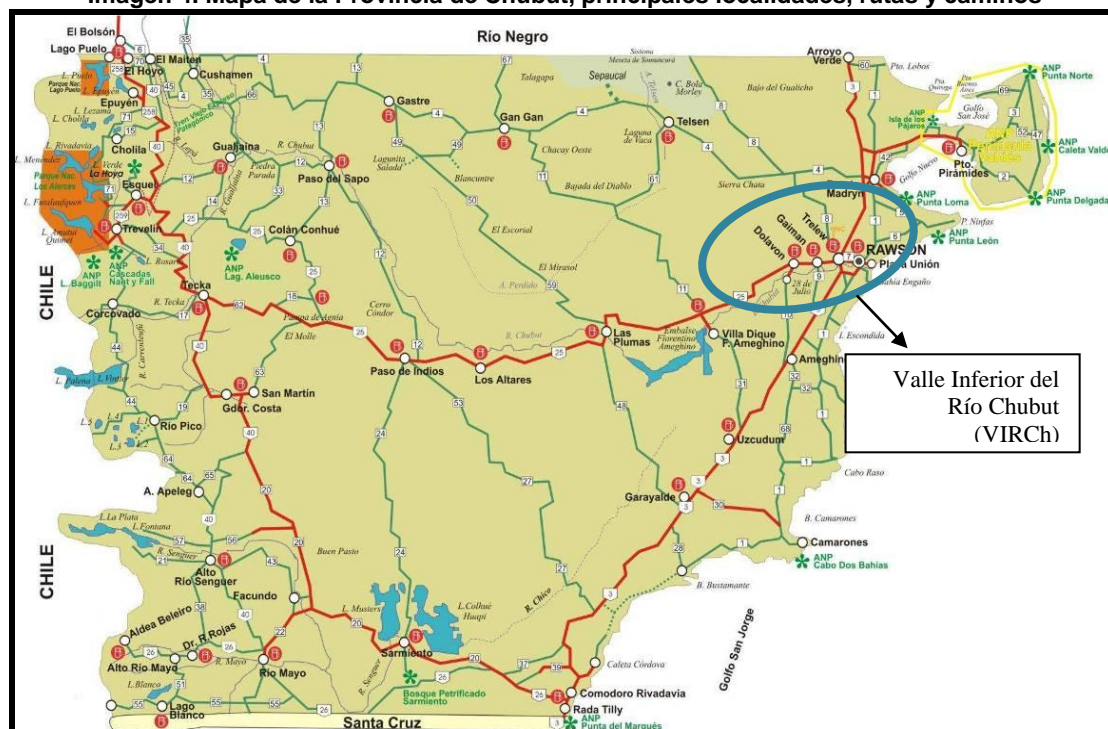
Imagen 4. Mapa de la Provincia de Chubut, principales localidades, rutas y caminos

Fuente: http://www.riosenquer.gov.ar/imagenes/Chubut-Rutas-Estaciones-de-Servicio2.jpg , 2010