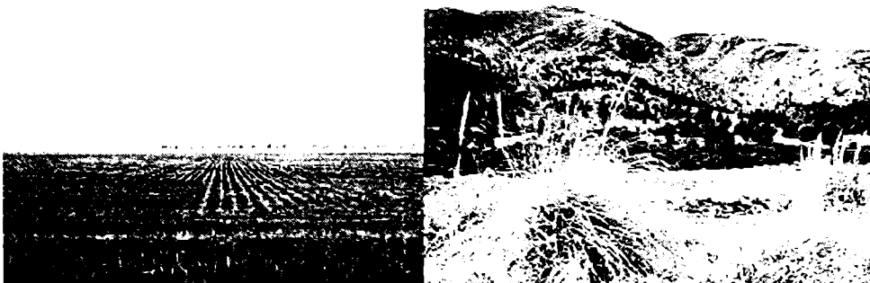
IMAGEN 2. a. Chasicó. cultivos desde Ruta Pcial N° 76. b. Sra. de la Ventana. desde Ruta Pcial. N° 76

En los espacios antropizados se impone la vegetación introducida a la nativa. El relato sobre los espacios productivos y de los recreativos se diferencia sutilmente. El pino en las sierras es narrado como “naturaleza”: los cultivos. pueden ser narrados como naturaleza. o como cultura según la circunstancia. a pesar de ser ambos “sembrados”.