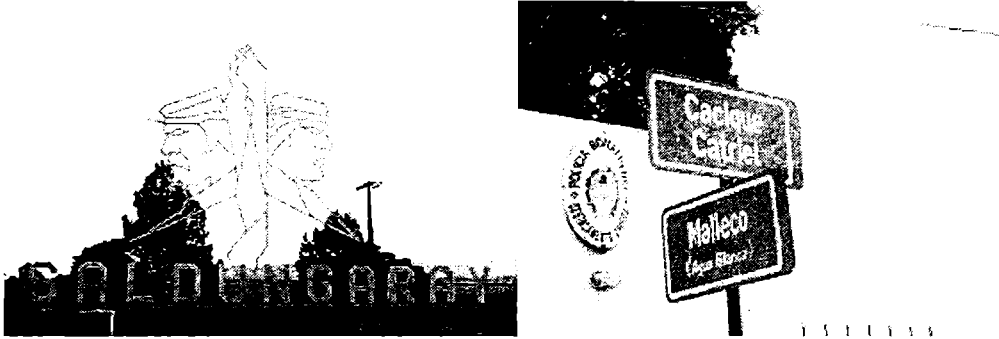
IMAGEN 3. a. Saldungaray: monumento acceso a planta urbana b. Chasicó. Cartelería en nombre de calles

La presencia de lo indígena aparece en forma esporádica mediante diversos mecanismos. Las operaciones de reposicionamiento y los relatos varían según el momento de la realización de la operación, y puede leerse y narrarse en diversas claves, pero se encuentran en lugares marginales en relación a la naturaleza y a las marcas territoriales de otro origen.-