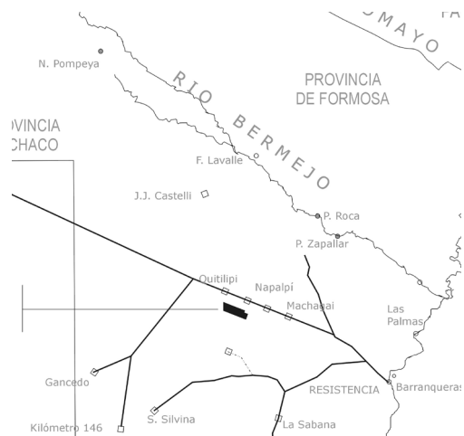
Mapa 1 Ubicación de la Reducción de Indios de Napalpí (Mapa realizado por el autor)

La Reducción de Indios de Napalpí fue fundada en el centro-este de la actual provincia del Chaco, con una extensión