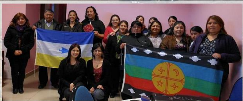
Mesa de Trabajo de la Modalidad de Educación Intercultural Bilingüe. Octubre, 2012

El nombre originario que se daban a sí mismos aquellos que vivieron en tiempos remotos en lo que hoy es el noroeste de Santa Cruz es actualmente desconocido. Patagón, aónik'enk, tehuelche, chónek, mapuche o paisano son nombres que aparecen mencionados en diarios, cartas y relatos de exploradores y viajeros blancos que llegaron a Patagonia desde el siglo XVI en adelante. También es habitual leerlos en trabajos escritos en el ámbito académico-educativo. Algunos de estas denominaciones no responden a nombres que realmente usaran los indígenas para referirse a sí mismos y que reflejaran, entonces, su pertenencia cultural , sino que fueron etiquetas impuestas por otros grupos, indígenas o criollo-europeos ("blancos"). Hoy los términos tehuelche y mapuche han sido mantenidos por los indígenas patagónicos para autodenominarse , designar su pertenencia, reafirmar su identidad y revitalizar sus prácticas culturales.