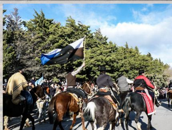
Jóvenes tehuelches en el desfile del 9 de Julio. Las Heras, 2012