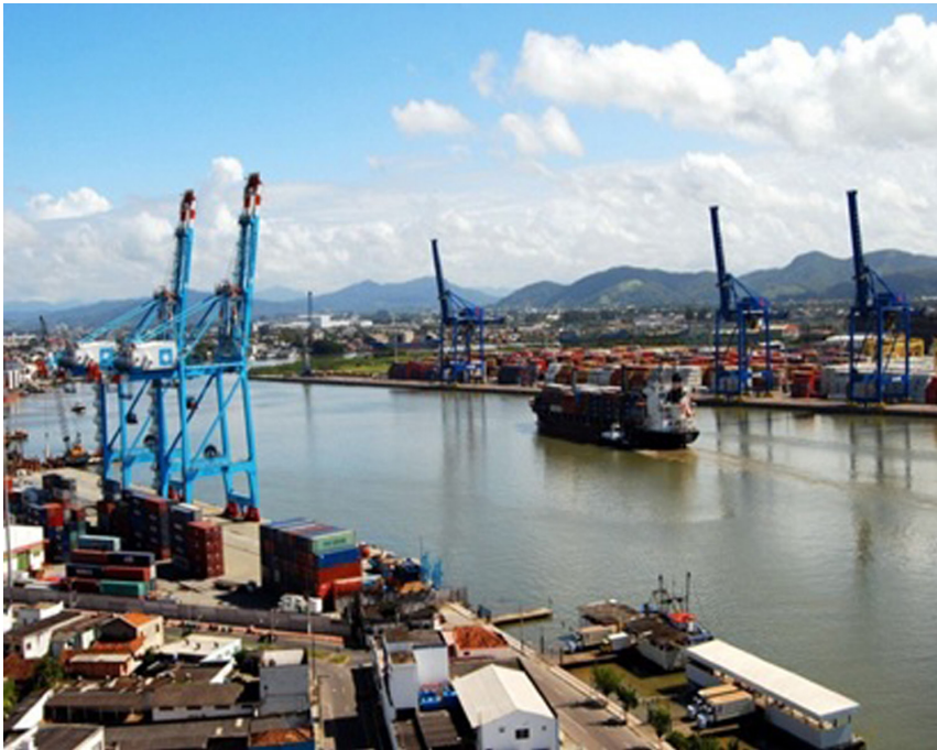
Figura 2. Complexo portuário de Itajaí-Navegantes/SC.