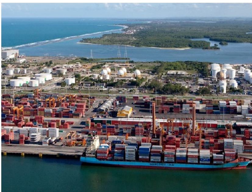
Figura 4. Complexo Portuário de Suape/PE, 2017.