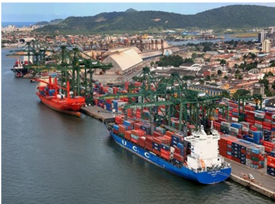
Figura 1. Porto de Santos/SP.

Há diferenciações no sistema portuário das unidades federativas brasileiras, quais sejam: em São Paulo, no Paraná, no Rio Grande do Sul, em Pernambuco e no Ceará os fluxos se concentram basicamente em um único porto (Santos/SP, Paranaguá/PR, Rio Grande/RS, Suape/PE e Pecém/CE), já no Rio de Janeiro, na Bahia e em Santa Catarina há uma maior desconcentração portuária (Rio de Janeiro/RJ, Itaguaí/RJ, Angra dos Reis/RJ, Salvador/BA, Aratu/BA, São Francisco do Sul/SC, Itapoá/SC, Itajaí/SC, Navegantes/SC, Imbituba/SC etc.) – Figuras 1, 2 e 3.