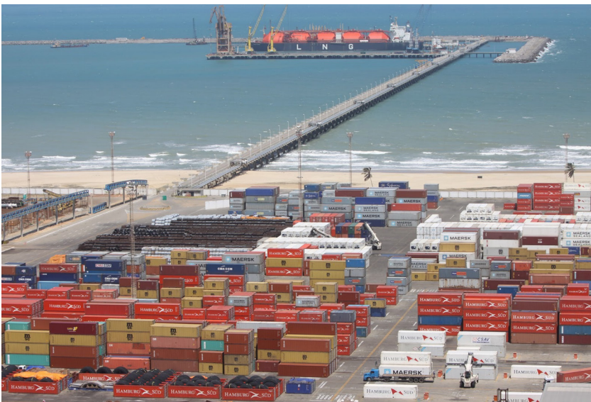
Figura 6. Porto de Pecém/CE, 2017.

O setor portuário brasileiro registrou um aumento de 8,3% na movimentação total de cargas em 2017, em comparação a 2016, (totalizando 1,08 bilhão de toneladas). No que tange aos contêineres, houve elevação da tonelagem e dos TEUs (medida equivalente a 20 pés), sendo movimentados 106,2 milhões de toneladas (valor 6,1% superior ao registrado em 2016) e transportadas em 9,3 milhões de TEUs (aumento de 5,7%). A carga que apresentou maior incremento (10,3%) foi o granel sólido, com escoamento total de 695,4 milhões de toneladas em 2017. Milho e soja apresentaram crescimento de 71,8% e de 31,5%, respectivamente, na comparação 2017/2016. Já o granel líquido registrou movimentação de 230,2 milhões de toneladas em 2017 – um aumento de 3,8% na comparação com o ano anterior. Os terminais de uso privado (TUPs) movimentaram 721,6 milhões de toneladas em 2017. Em 2016, a movimentação foi de 660 milhões de toneladas, o que representa um incremento de 9,3%. Os portos públicos apresentaram crescimento de 6,3%, registrando uma movimentação de 364,5 milhões de toneladas (Antaq, 2018).