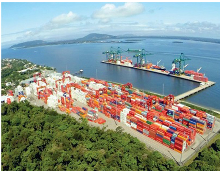
Figura 3. Terminal de Itapoá/SC.

De acordo com Rangel (2005), o Estado – com base no planejamento – deve criar condições para o espraiamento da produção industrial. Assim, precisa aplicar uma determinada quantidade de recursos nos espaços periféricos para melhorar suas condições materiais (rodovias, ferrovias, dutovias, portos, aeroportos, energia elétrica, saneamento básico etc.). As inversões estatais geram demanda e, a partir dos investimentos privados, potencializa-se a dinâmica produtiva, comercial e os serviços. O setor