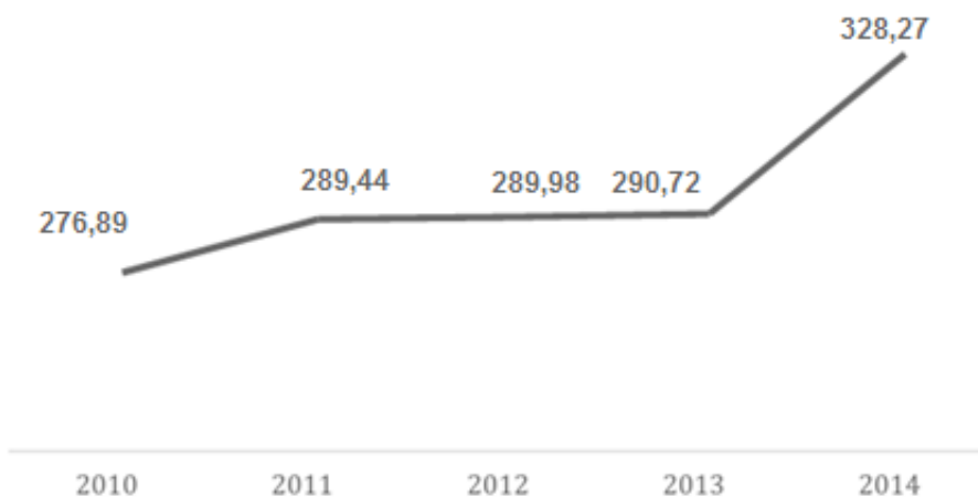
Gráfico 3. Tendencia de los costos por artículos indexados en el SJR***

***Valores convertidos a dólares (1GBP=1,327USD) (2/10/2017)