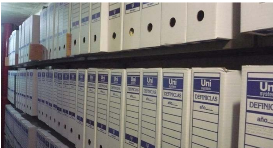
Imagen 1. Colección de programas de mano de la BNCJM

A partir de estas condiciones y siguiendo la misma línea del escenario descrito se identificó la siguiente pregunta de investigación: