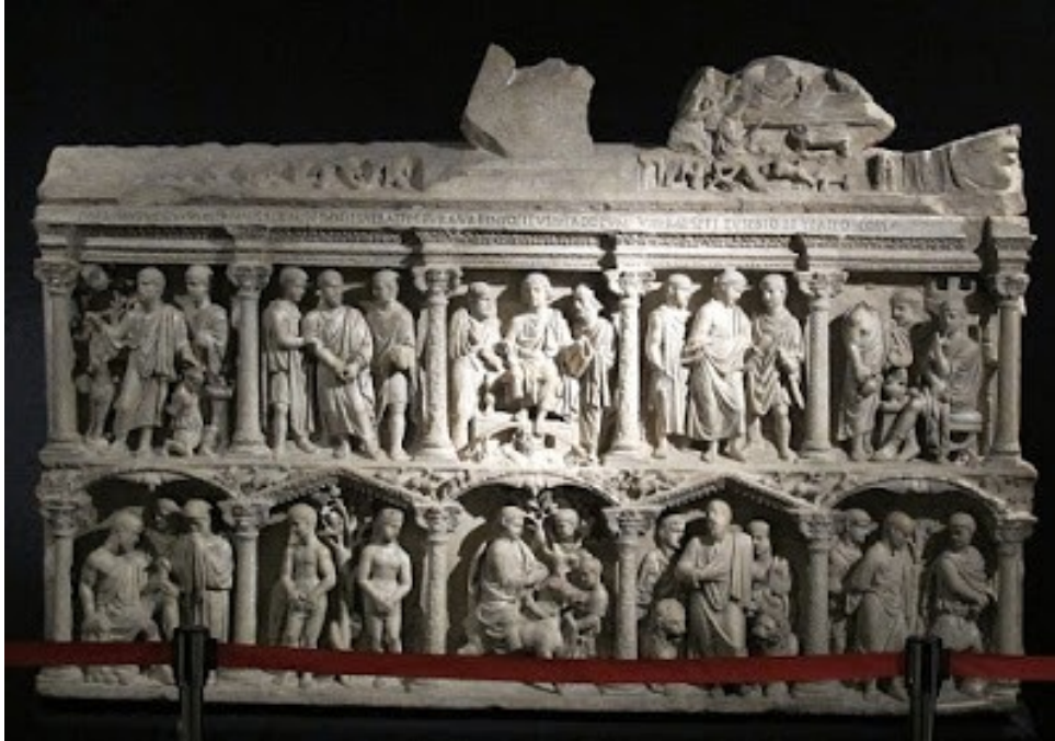
Figura 6: Sarcófago de Junio Basso. Roma. Grutas Vaticanas