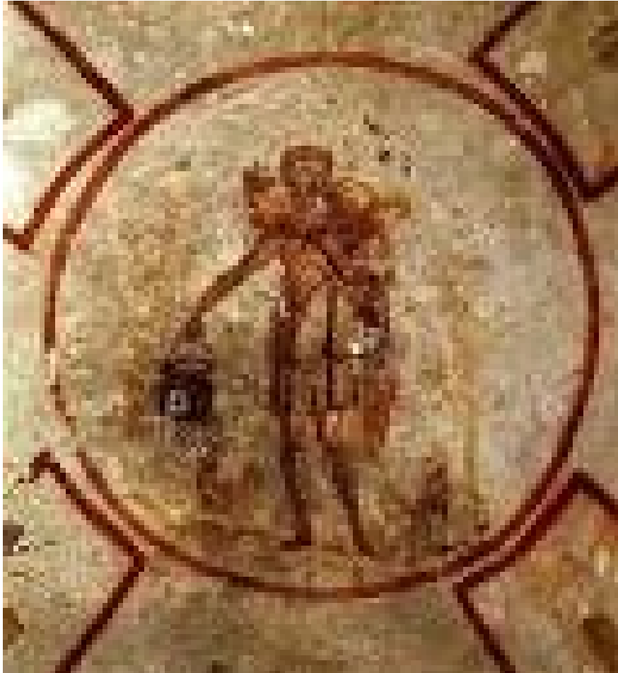
Figura 3: El buen Pastor. Roma, Catacumba de Calixto Cripta de Lucina