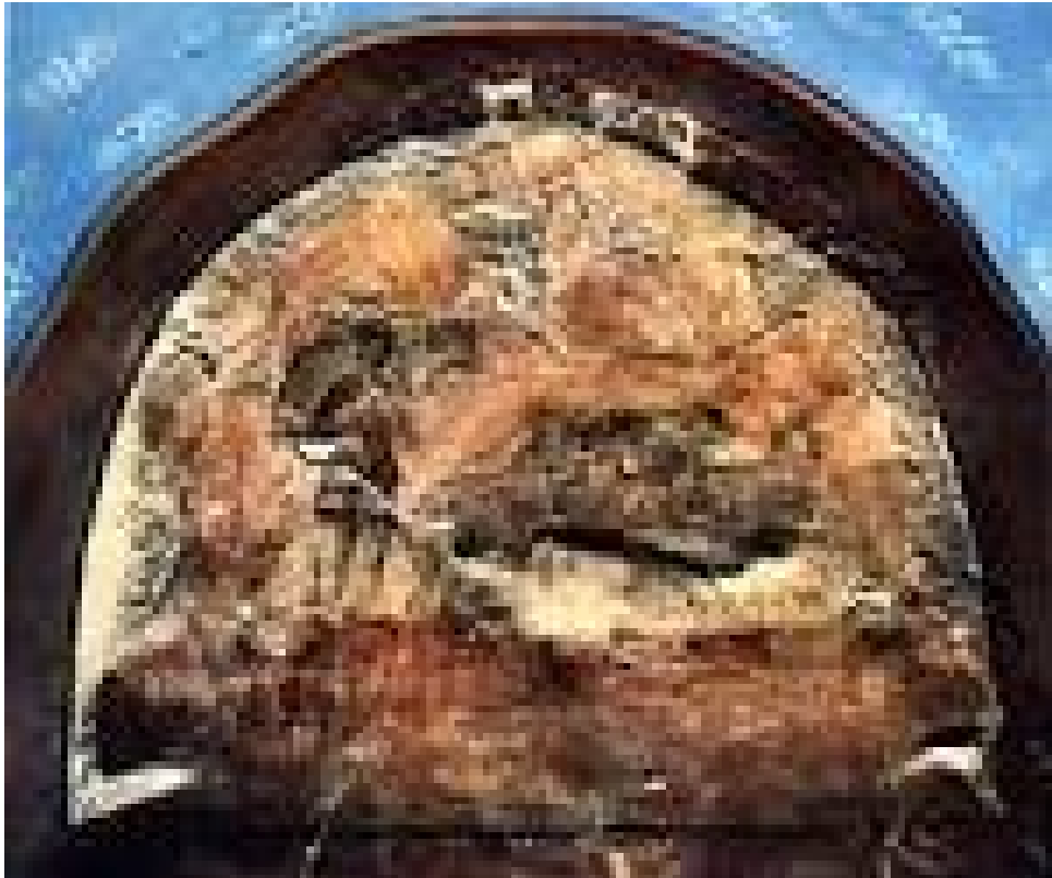
Figura 4: Dura Europos. Luneto del Baptisterio. Yale University