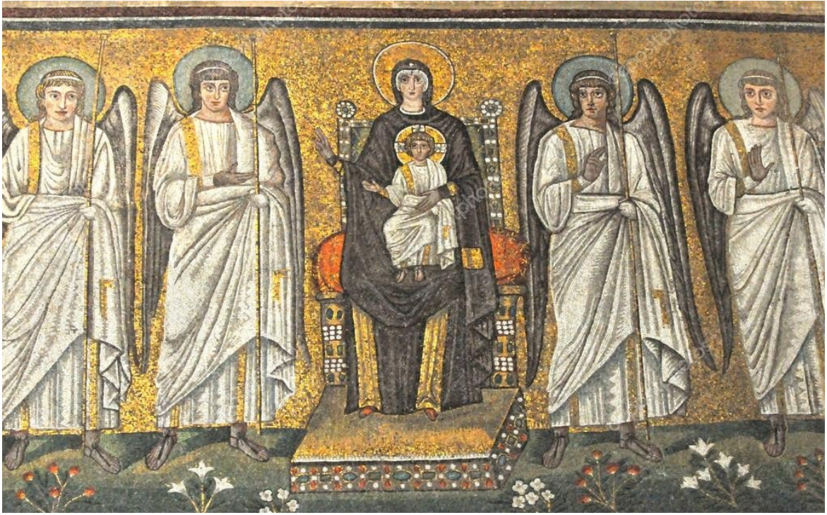
FIGURA 3: Virgen María entronizada