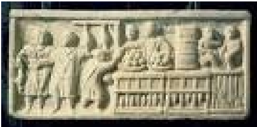
Figura 2: Emblema de una vendedora de hortalizas. Museo de Ostia