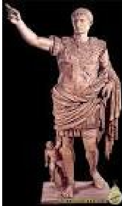
Figura 1: Augusto. Villa de Livia en Prima Porta