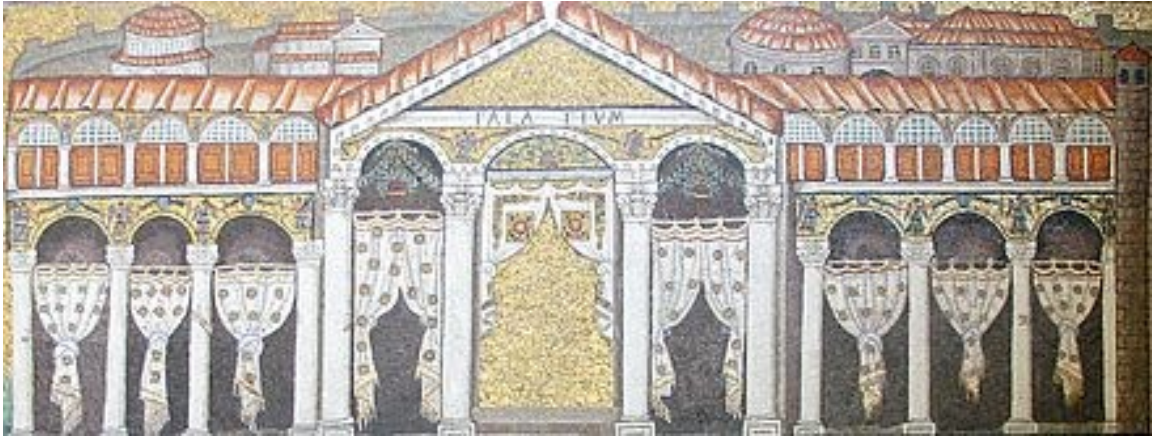
FIGURA 2: Palacio de Teodorico