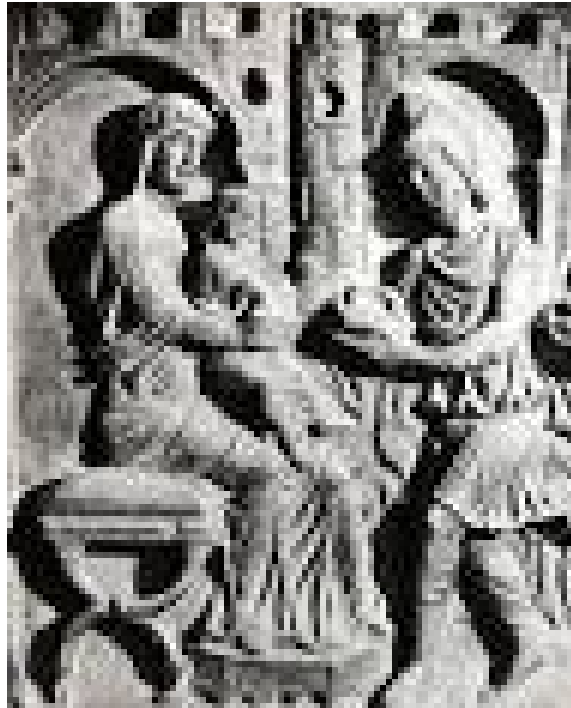
Figura 5: Sarcófago de Flavio Julio Catervio. Catedral de Tolentino