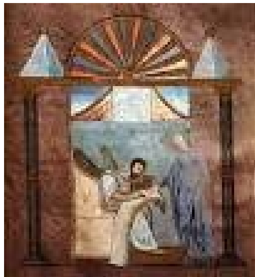
Figura 7: Evangelario de Rossano. Catedral de Rossano