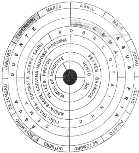
Figura Nro. 1: Diagrama do Prof. Castro Faria técnicas consideradas mais sofisticadas e a captura de espécies como o robalo e a tainha atestavam a abundância e a riqueza do ecossistema lacustre no imaginário da região, para além de Ponta Grossa dos Fidalgos.

Um período onde a vida em Ponta Grossa, embora dura e sofrida, era também considerada pelos pescadores mais calma. As pessoas eram todas conhecidas e o lugar não seria tão movimentado como nos dias de hoje. Somos apresentados a uma espécie de nostalgia nativa lembrada através de frases como “no tempo das canoas...”.