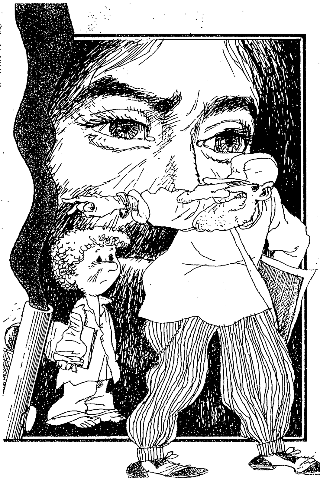
La fortaleza conquistada